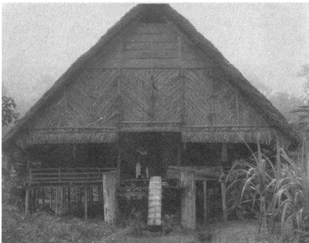
Die Umsiedlung in Indonesien zerstörte die traditionellen Wohn- und Hausformen. Heute werden die Häuser aus »modernen Materialien« in den Umsiedlungsgebieten gebaut.

In dieser Situation kommt dem von der Weltbank geförderten Projekt der Umsiedlung von der Hauptinsel Java auf andere Inseln eine erhöhte Bedeutung zu. Die staatlich geplante Umsiedlung – Transmigrasi – begann 1905, ein Umstand, der von vielen Welt-