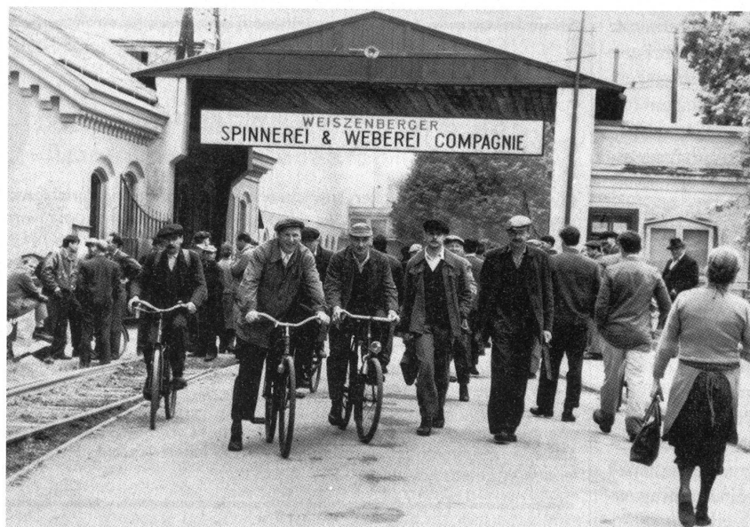
Arbeiter in Marienthal

Szenenfoto aus einem Fernsehfilm von Karin Brandauer, Foto: ORF