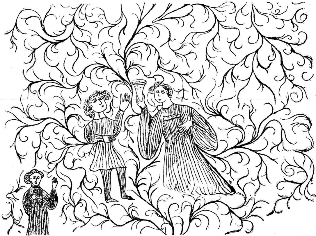
Fig. 32 und 33. Stein a. Rh. Mittelalterliche Karikaturen im Kloster S. Georg (nach den Originalien durchgezeichnet von Prof. Dr. Ferd. Vetter).