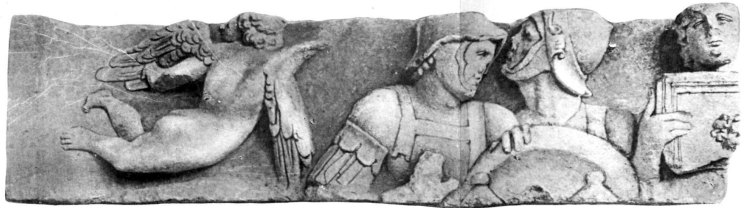
2 a. 1:10.