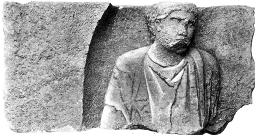
3 a. 1:10.