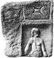
3 b. 1:10.