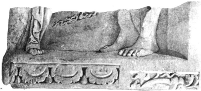
2 b. 1:10.