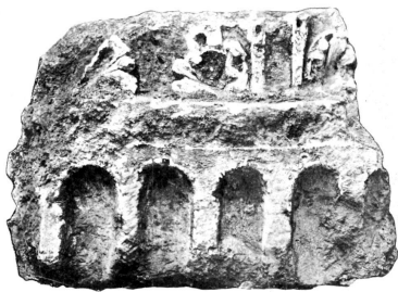
4 b. 1:10.