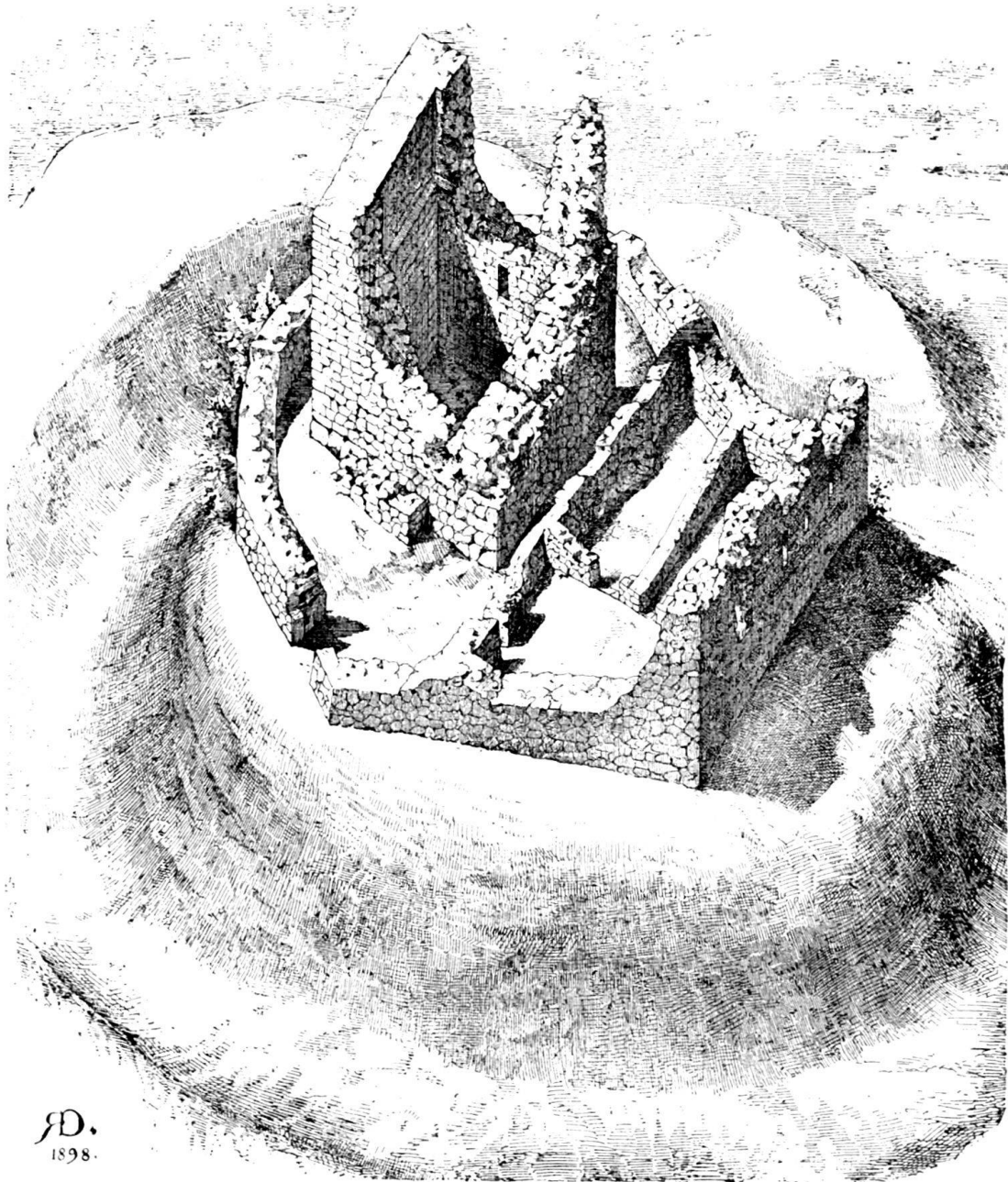
Ruine Attinghausen, 1897. Zeichnung von Dr. R. Durrer.

der Mauerkerne ist in bekannter Weise aus einem Füllwerk von Kalkmörtel und kleinem Geschiebe hergestellt, nur an der östlichen Ecke der Südseite und im Fundamente des Turmes finden sich grössere Steinblöcke bis zu 1½ m Länge. — Der Turm diente wohl Wehr- und Wohnzwecken zugleich; in seinem Umfange stimmt er, wie Herr Dr. Zeller-Werdmüller nachgewiesen,