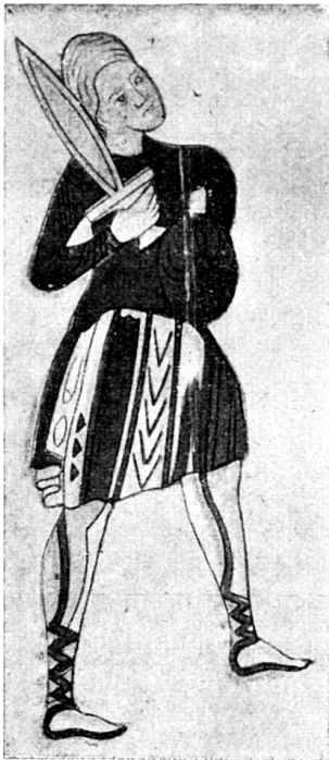
Fig. 2 (nach Hefner-Alteneck).

in peinlich exakter Weise eingeklebt und von Kellers Hand kommentiert worden sind.