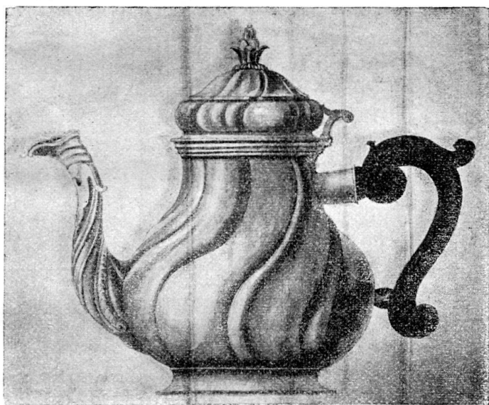
Fig. 90. Theekanne (Handzeichnung) von Johann Ulrich Fechter IV. (Staatsarchiv Basel.)

Seiner Kunst scheint jedoch Joh. Ulrich IV. nicht lange treu geblieben zu sein, denn er nahm bald darauf Kriegsdienste, und schon 1767 treffen wir ihn als Offizier im französischen Regiment Lullin de Châteauvieux (Vaterlandsche. Bibl. Basel: Basler Standestruppe u. Werbungen Nr. 277). 1792 war