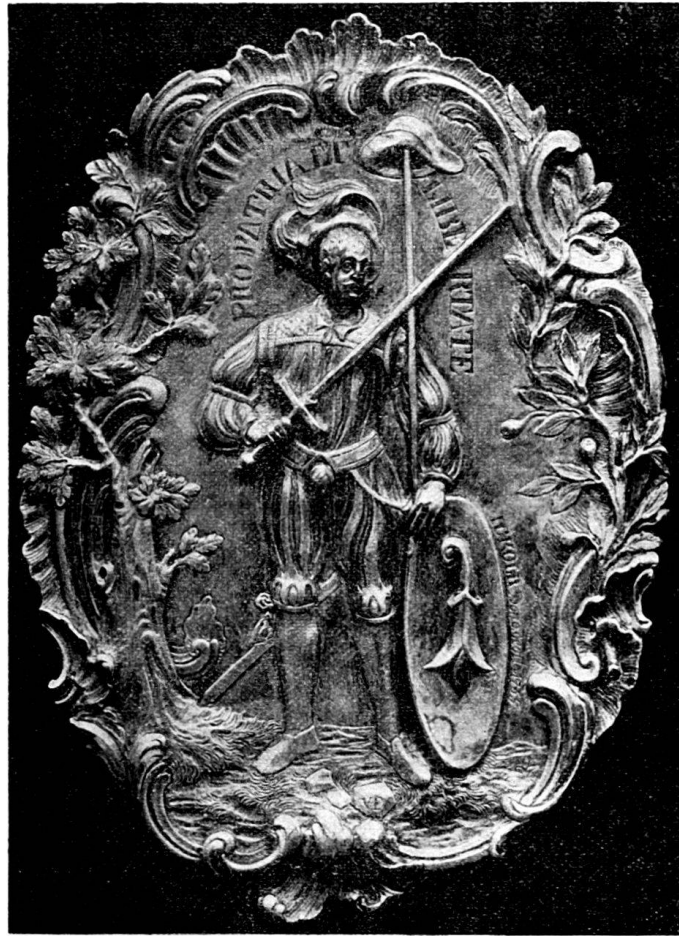
Fig. 91. Bandelierschild von Joh. Ulrich Fechter IV. (resp. III.). (Im Histor. Museum zu Basel.)

Zum Schlusse sei noch der silbergetriebene Bandelierschild (Fig. 91) erwähnt, welcher auf dem Bandelier eines Tambourmajors angeheftet ist und sich im Historischen Museum zu Basel befindet. In der Mitte einer reizenden Rokokocartouche, welche links von einer Eiche, rechts von einem Lorbeerzweig anmutig eingefasst wird, sieht man die gutgebildete Gestalt eines Kriegers in der Tracht des 16. Jahrhunderts, welcher mit der Rechten sein Schwert erhebt und mit der Linken eine Stange mit Freiheits-