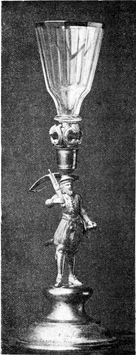
Fig. 88. Trinkglas mit Armbrustschützen als Träger. Von Johannes Fechter. (Im Histor. Museum zu Basel.)

Gefälligere Form zeigt schon das Kelchglas mit einem Armbrustschützen als Träger (Fig. 88), welches im Jahre 1748 der Vorstadtgesellschaft zum