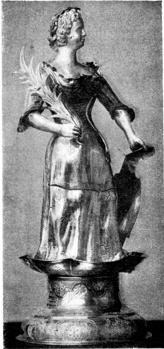
Fig. 86. Ehrenzeichen der Vorstadtgesellschaft „zur Magd“ in Basel, von Joh. Ulr. Fechter II.

Außerdem gibt es noch 7 Löffel der Spinnwettern-, 2 Gabeln und 2 Löffel der Safran-, 2 Gabeln der Weberzunft und 4 Löffel der Feuerschützengesellschaft in Basel, welche seine Marke tragen und teils jetzt noch Eigentum dieser Zünfte, teils in Privatbesitz sind; sämtliche Stücke sind mit Wappen und Inschriften geziert (Misc. Fechter).