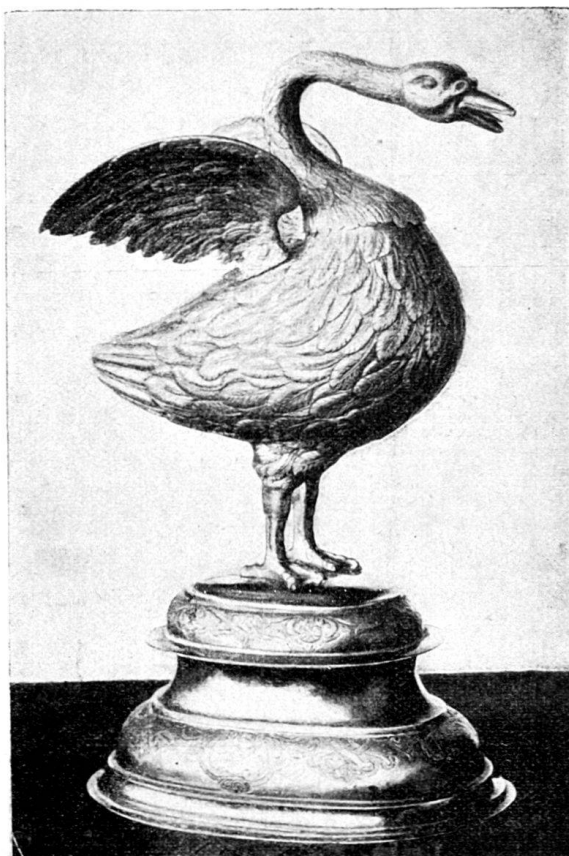
Fig. 87. Becher in Form eines Schwanes. Von Johannes Fechter. (In Privatbesitz.)

Ein Trinkgefäß in Form eines Schwanes mit abnehmbarem Kopf befindet sich in Privatbesitz (Fig. 87). Allerdings ist der Vogel nichts weniger als zierlich gebildet. Ein schwer fälliger Leib mit ziemlich kleinen Flügeln ruht auf grobknochigen Beinen und scheint eher einer Gans als einem Schwane anzugehören, an welchen nur Kopf und Hals erinnern. Basis und Tier stehen in gutem Verhältnis zu einander, die Füße und besonders der Kopf sind gut beobachtet, so daß, trotz aller Derbheit, diesem Jugendwerk eine gewisse Wirkung nicht abgesprochen werden kann. Am untersten Wulste der Basis ist vorn und hinten je ein Wappenschild angebracht; während aber der vordere leer ist, erscheint im hinteren ein Faß