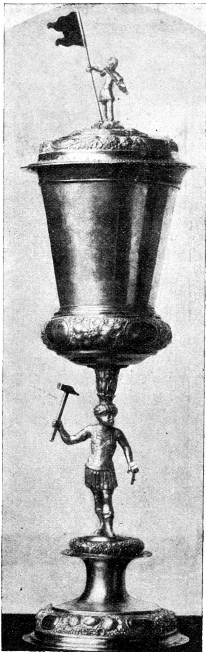
Fig. 85. Willkomm der Schlossergesellen, von Joh. Ulr. Fechter II. (Im Histor. Museum zu Basel.)

dem Kniestück des hl. Johann von Nepomuk auf der Rückseite dürfte ebenfalls von unserm Meister verfertigt sein.