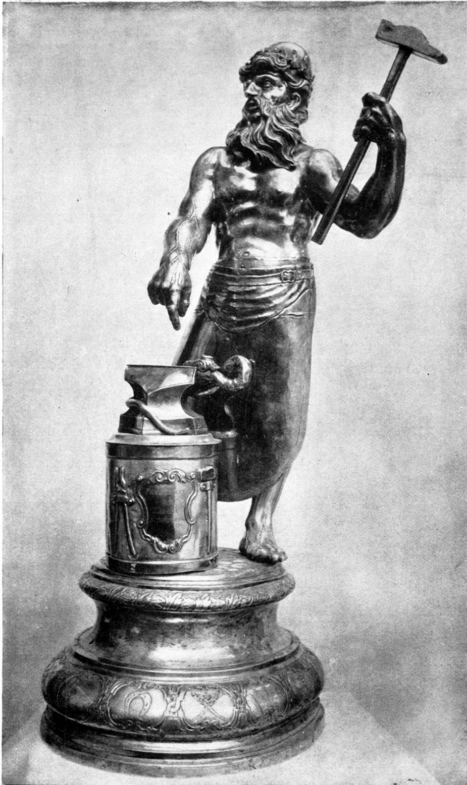
Vulkan-Becher der Schmiedezunft, Bern. Von Johann Ulrich Fechter II. (Im Histor. Museum zu Bern.)