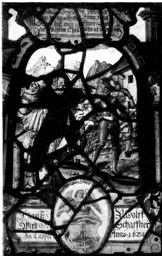
89. Scheibe im Museum zu Aix.

4. (Nr. 1642.) Die Rache der Chiorama, XVII. Jht.. Zwei Bilder getrennt durch einen Pilaster, auf dem ein Atlante sich abhebt. Anspielung auf folgendes Ereignis aus der Römergeschichte: Während des Feldzuges des Manlius Vulso gegen die Galater in Kleinasien (189), war Chiorama, die Frau des Tetrarchen Ortiagon, dem Feinde anheimgefallen und von einem römischen Centurio entehrt worden. Sie erhielt das Versprechen, gegen eine Loskaufssumme, welche ein galischer Sklave nachts am Flußufer übergeben sollte, in Freiheit gesetzt zu werden. Folgende Szene ist hier dargestellt: Rechts enthauptet der Sklave den Centurio auf Befehl Chioramas, links übergibt Chiorama den Kopf des Römers ihrem Gatten Ortiagon. Der Name des letzteren ist auf dem Sockel seines Throns geschrieben. Den Namen des Künstlers „Gottfried Stadler“ 1) liest man auf den Stufen rechts. Der untere Teil besteht aus Arkaden, worin zwei Schützen Platz gefunden haben.