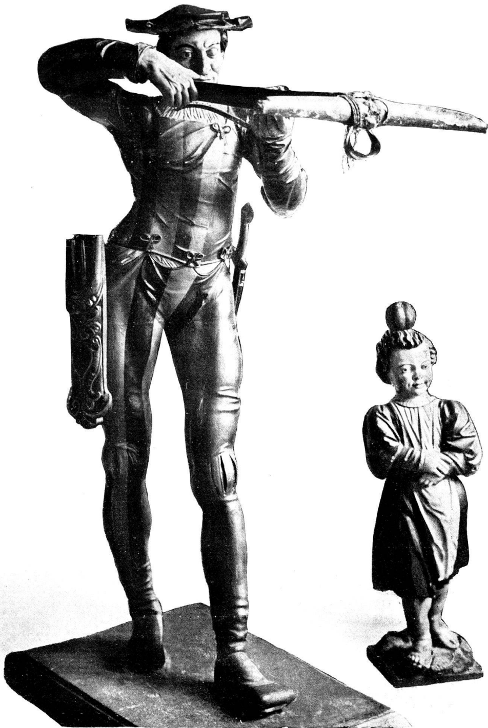
TELL UND SEIN KNABE.