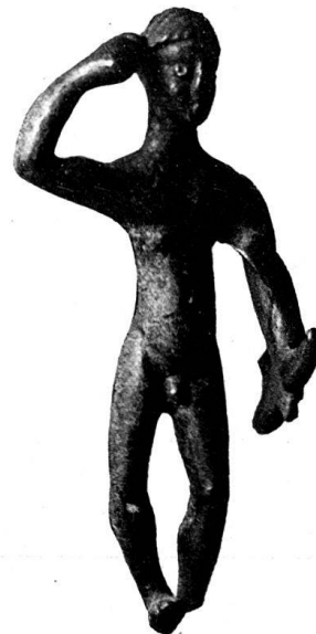
n o 4.