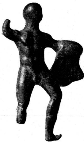
n o 5.