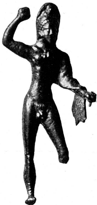
n o 2.

Les plus intéressants sont, dans l'ordre chronologique: la tête féminine (n o 20), la statuette de Dioscure (n o 18), et l'amulette (n o 24).