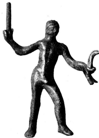
n o 3.