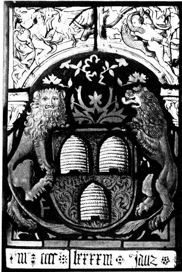
Abb. 4. Wappenscheibe von Büren. Historisches Museum in Bern.

Zu den ältesten Arbeiten unseres Meisters gehört eine Wappenscheibe der Familie von Büren im historischen Museum in Bern (Abb. 4). Sie stellt auf großmustrigem Damaste den Wappenschild in der älteren Form der zweiten Hälfte des 15. Jahrhunderts dar, gehalten von zwei Löwen, die in ihrer Zeichnung noch stark an die Arbeiten des Hans Noll erinnern. Diese Schildhalter sind für ein Privatwappen sehr auffallend und legen darum die Frage nahe, ob es nicht nachträglich an Stelle eines Bernerschildes eingesetzt worden sei. Auch der untere Teil der Scheibe scheint darauf hinzudeuten, daß sie ursprünglich als Umrahmung nur den in den 1480er Jahren gebräuchlichen Bandstreifen hatte. 1493 muß sie restauriert worden sein. Darauf weist die Jahrzahl mccccxxxiii in gotischen Minuskeln und das Wort „ jauz “, das offenbar heißen sollte „ jars “. Das Oberstück zeigt die damals beliebten Kampfszenen zwischen Kriegerern oder zwischen Jägern und wilden Tieren, verchlungen in das Astwerk des abschließenden Bogens über den Nappen oder Figuren. Auch bei den beiden hier dargestellten