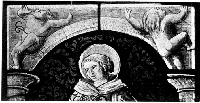
Abb. 3. St. Laurentius. Ausschnitt aus einer Figurescheibe in bernischem Privatbesitz.

uns als Bildumrahmungen in Zeichnungen des Hans Baldung Grien in der Sammlung Wyß erhalten blieben (Hist. Museum Bern, Bd. I, fol. 26 und 28). In diesem Glasgemälde, das schon dem Anfange des 16. Jahrhunderts angehört, verrät der alternde Meister, wie schwer es ihm fällt, die mit größerer Sicherheit begangenen Pfade der spätgotischen Kunst zu verlassen.