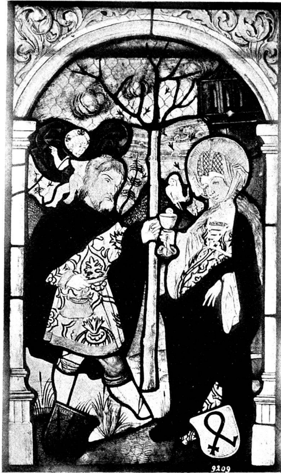
Abb. 5. St. Christoph und St. Barbara. Historisches Museum in Bern.

Nach einer Urkunde, die König Rudolf von Habsburg am 1. November 1283 im Lager von Peterlingen ausstellte, hatte der Vogt Ulrich von Thorberg den Ort befestigt und bat darum den König, denselben zu einer Stadt zu erheben. In der Tat wurde diesem Wunsche entsprochen. Kirchberg sollte der gleichen Rechte und Pflichten teilhaftig werden, wie die Stadt Bern, und einen eigenen Wochenmarkt bekommen. Doch wuchs in der Folge die junge Stadt nicht über die Kirche und ein paar Häuser hinaus. Nachdem der letzte Thorberger seine Burg in eine Karthause verwandelt und die Schirmherrschaft über dieselbe der Stadt Bern übertragen hatte, baten die Mönche nach seinem Tode ihre Schirmherrin