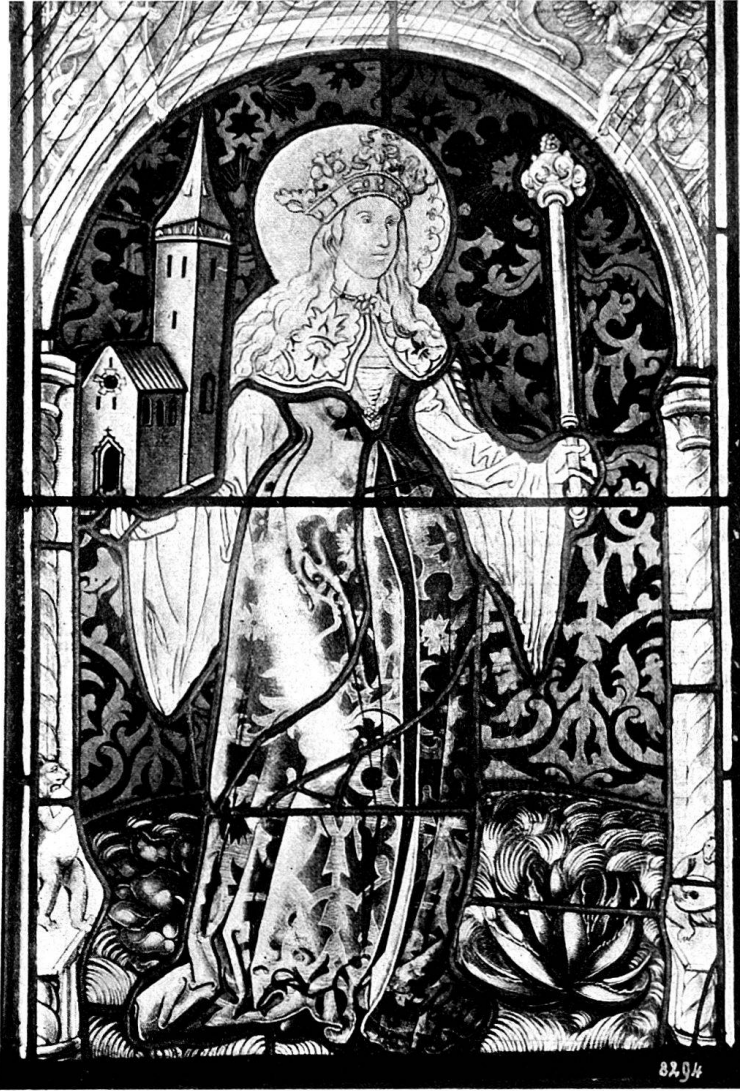
Abb. 6. St. Adelheid. Kirche von Kirchberg, Kt. Bern.