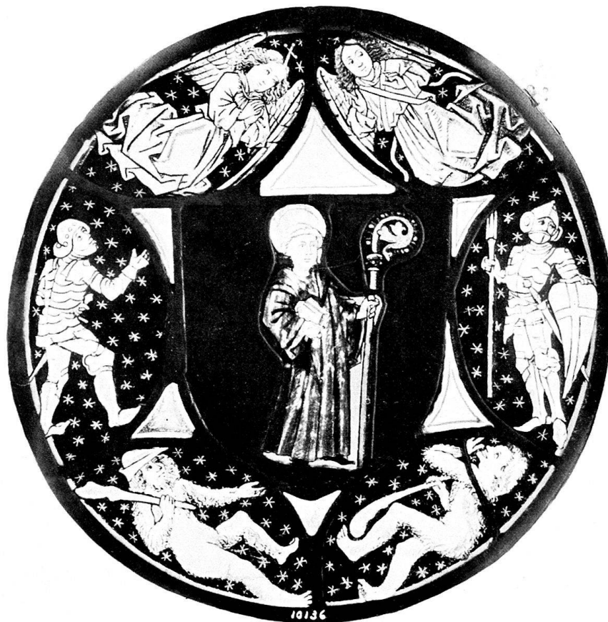
b. Standesscheibe von Glarus. Schweiz. Landesmuseum.