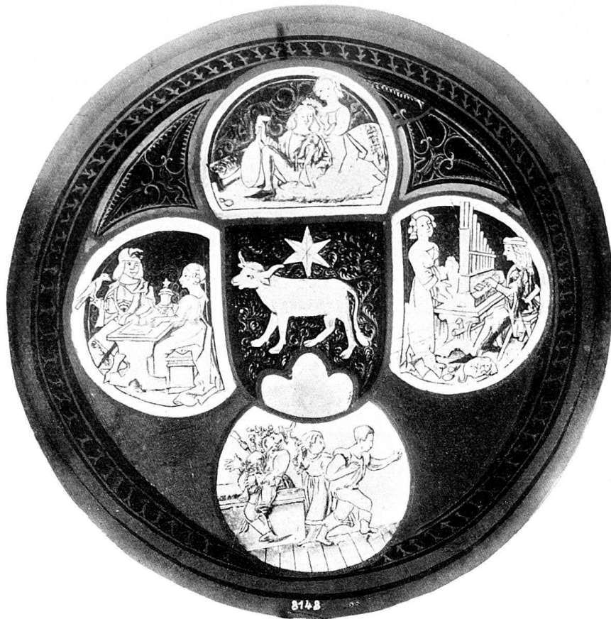
a. Vierpaßscheibe im Rittersaal des Schlosses in Thun.