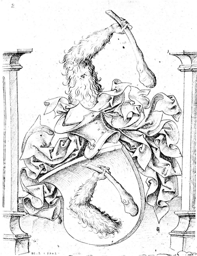
Abb. 1. Entwurf zu einer Wappenscheibe. Hist. Museum in Bern.

Handwerk der Glasmaler, denn sie konnten auch zeichnen und infolgedessen die Vorlagen (Risse) zu ihren Arbeiten selbst entwerfen oder doch kopieren. Leider blieben uns aus dem 15. Jahrhundert nur wenige Zeichnungen erhalten, die wir als Vorlagen ausschließlich zu Glasmalereien ansprechen dürfen, und diese stammen fast alle aus dem letzten Jahrzehnt. So bewahrt u. a. die große Scheibenriß-Sammlung Wyß im Bernischen Historischen Museum nur ein Vorlageblatt zu einer Wappenscheibe (Bd. I, fol. 2), dem noch ganz der Charakter der Kunst des ausgehenden 15. Jahrhunderts inne wohnt (Abb. 1) und dessen