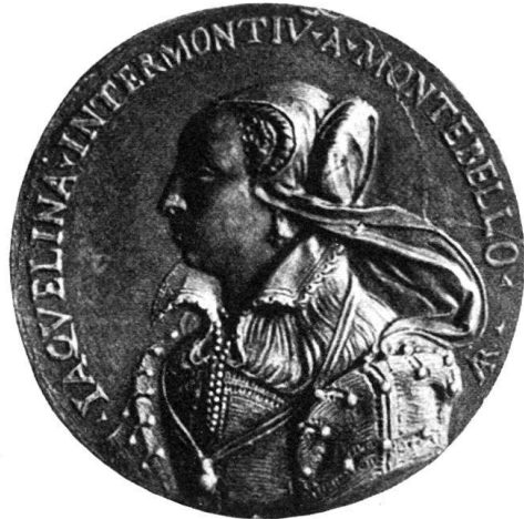
Abb. 5. Blei - Basel.

sprochen und wiedergegeben werden, die, soviel mir festzustellen möglich war, unrichtig bestimmt, äußerst selten oder unediert sind.