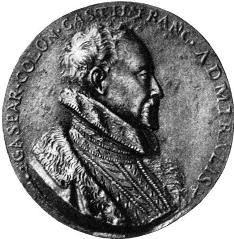
Abb. 4. Blei - Basel.