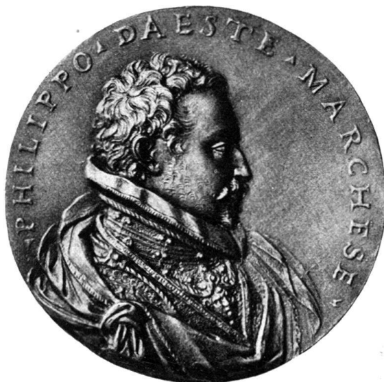
Abb. 6. Blei - Basel.

Es scheint mir nicht ohne Interesse, unser Exemplar hier abzubilden, da es so scharf und unberührt aussieht, als wäre es eben erst nach dem Wachsmo- dell gegossen. Ich glaube es sicher auch dem Alessandro Ardeni zuschreiben zu dürfen. Besonders mit der Coligny-Medaille weist die Este-Medaille große Verwandtschaft auf. Man vergleiche, wie der Körper bei beiden