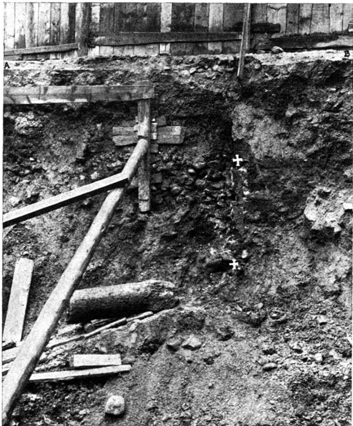
Fig. 1. Les deux + indiquent la place occupée par le milliaire au moment de la découverte. A-B, coupe de la chaussée de la rue de la Rôtisserie.

Les démolitions qui se poursuivent, depuis une vingtaine d'années aux Rues-Basses et principalement sur le côté sud de la rue du Marché, ont presque toujours amené la découverte de quelques vestiges de l'époque romaine, morceaux d'architecture, inscriptions, poteries et menus objets, mais aucune de ces trouvailles ne revêt l'importance de celles qui ont été faites sur un même chantier, de mai à juillet 1917, et c'est pourquoi les monuments retrouvés à cette occasion nous ont paru dignes, par l'intérêt qu'ils présentent à des titres divers, d'être signalés à l'attention des archéologues et des historiens.