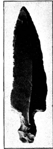
Abb. 18. Feuersteinlanzenspitze v. Buonas. 1 : 2. Sammlung Grimmer.

Nach einer Mitteilung von Herrn M. Speck 1) hat auch bei diesem Pfahlbau der Sturm vom 4./5. Januar 1919 wieder neue Teile bloßgelegt: „Gegenwärtig sieht man am Ufer unter den Wurzeln eines Baumes einen Querbalken und mächtige Pfähle“. — Im Frühling 1920 sammelten die Herren Speck 2) am Ufer 16 gekerbte Steinplättchen, 10 Serpentinbeile vom Dicknacktypus, einige Silexlamellen und verschiedene andere Steinartefakte, ferner eine 11 cm lange Ahle aus Hirschhorn.