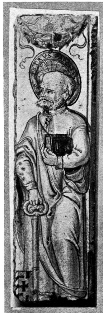
Abb. 2. Lisene, angeblich zu dem Ofen aus Beromünster gehörend.

das erstere bejahen. Darauf weist die Wappenfigur, der in Form einer Pflugschar gezeichnete Hafnerspaten. Noch mehr aber wird dies bestätigt durch ein im Historischen Museum in Basel aufbewahrtes Glasgemälde (Abb. 1). Diese Scheibe zeigt eine auf den Namen unseres Meisters lautende Stifterinschrift. Eine Berufsangabe fehlt, wird jedoch ersetzt durch das eine der beiden