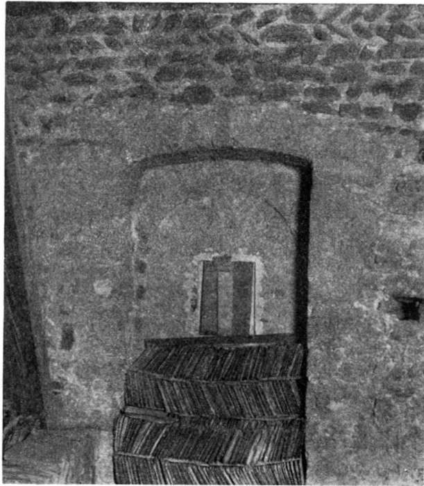
Abb. 10. Türöffnung im ersten Turmgeschoß nach S.

vom Nordturm her den Zugang zum Raum über der Vierung und über dem Südflügel zu öffnen, von dort her auch auf die Seitenschiffsdächer; zwischen ihnen wird also über der Vierung ein Boden gelegen haben 1) , und zwar wenig über dem Scheitel des damaligen Chorgewölbes, in der Höhe, wo sich jetzt die Hochgewölbe der ganzen Kirche erheben. Welcher Art diese Vierungsdecke gewesen und ob sie je ausgeführt worden ist, bleibt im Dunkeln. — Mit zunehmender Höhe werden die Einzelformen am Turm immer schlichter. Im Glockengeschoß setzen sich die Gewände der Schallöffnungen und der Blenden, die sie paarweise