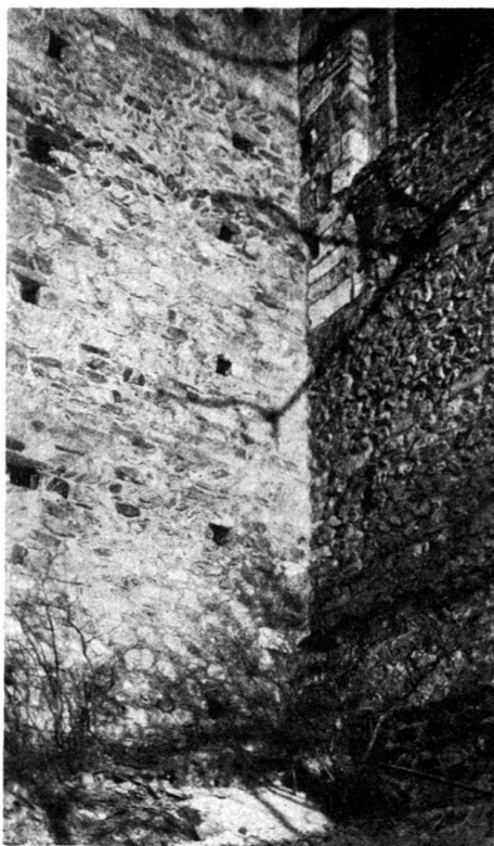
Abb. 8. Winkel zwischen nördl. Querschiff und Seitenschiff.

2. Es ist nun fraglich, ob italienischer Übung entsprechend auch da noch flache Holzdecken oder offene Dachstühle in allen drei Schiffen vorgesehen gewesen seien 1) ; «französische» Einflüsse scheinen mit dem fortschreitenden 12. Jahrhundert mächtiger geworden zu sein, und diesen ist eher eine Einwirkung zugunsten des Übergangs zum Wölbungsbau zuzutrauen. Die Pfeilerabstände und -formen liefern keine sichern Anhaltspunkte für ein bestimmtes