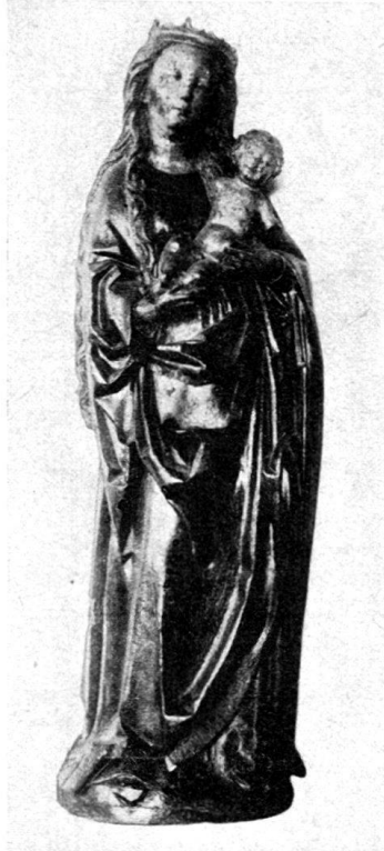
Marienfigur aus Graubünden.

von Arvigo, den das Schweizerische Landesmuseum birgt. Er ist nicht signiert, Rahn hat jedoch angenommen, daß er «unter dem Einfluß ... des Fronaltars von St. Maria in Calanca» (nun im historischen Museum in Basel) entstanden sei und Weizinger nahm ihn daraufhin in das Oeuvreverzeichnis Strigels auf. Weil die Vermutung nicht ganz fern liegt, daß bei dieser Zuschreibung auch die Nachbarschaft der Standorte — Arvigo liegt gleichfalls im Calancatal — eine gewisse Rolle spielte, so sei hier darauf hingewiesen, daß Arvigo erst die zweite