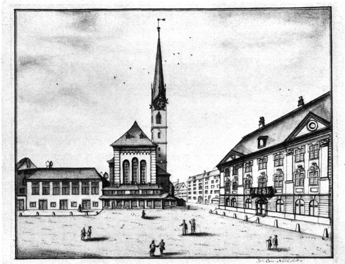
Abb. 3. „Prospect von der Frau-Münster Kirchen und neuen Meisen“.

Zeichnung von Joh. Conrad Nözli. Zürich, Zentralbibliothek.