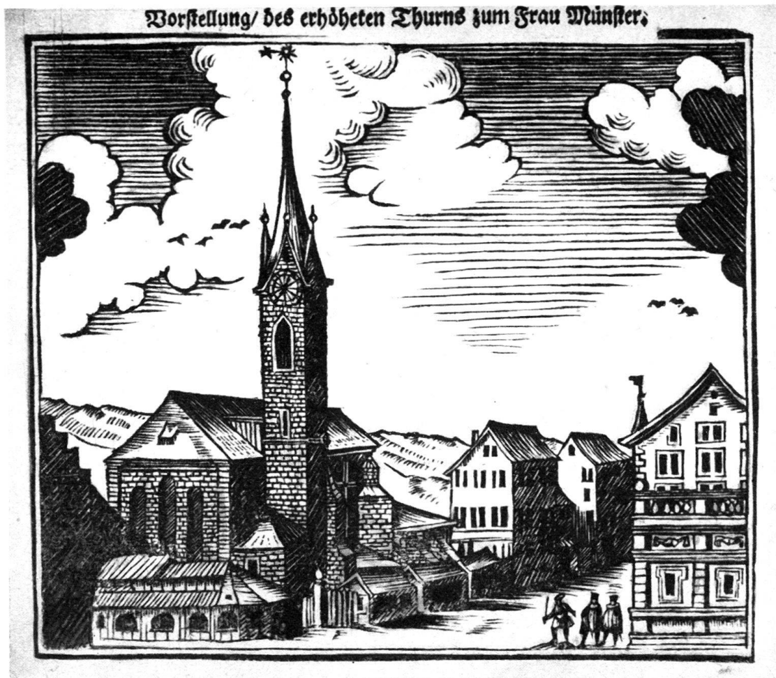
Abb. 2. Ansicht des Fraumünsters in Zürich. Holzschnitt nach 1732.