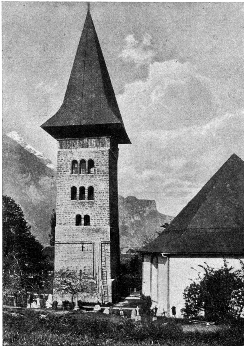
Fig. 1. Der romanische Glockenturm neben der Meiringer Kirche in seiner heutigen Gestalt. Ansicht von der Ostseite. Rechts daneben der Chor der Kirche. (Zur Zeit der photographischen Aufnahme waren gerade an der untern Turmhälfte eine Leiter angestellt und Wasserschläuche zum Trocknen aufgehängt). Hinten die Alpen in Richtung Rosenlauri.

Merkwürdig ist auch, daß der neben der heutigen Kirche stehende romantische Kirchturm eine andere Orientation hat als die seit romanischer Zeit in ihrer Orientation unverändert gebliebene Kirche (vgl. den hinten folgenden Grundplan). Man möchte daraus schließen, daß entweder der ursprüngliche Turm oder aber das ursprüngliche Sanktuarium in der Frühzeit anders orien-