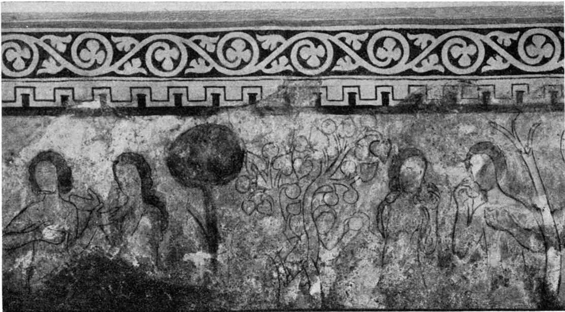
Fig. 4. Meiringen, Kirchenfresken.