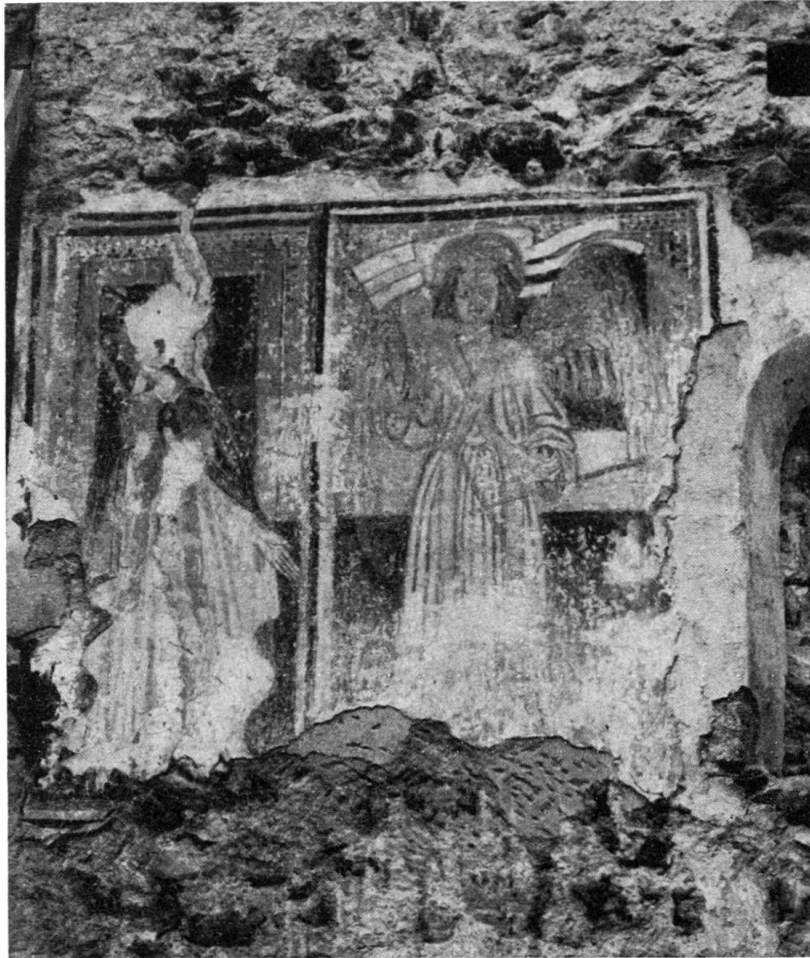
Fig. 2. Die zwei bei Anlaß der Kirchenrestauration Meiringen links auf der Südseite der Kirchenwand entdeckten gotischen Fresken von St. Petrus und (rechts) St. Michael. Photographische Aufnahme vor der Ergänzung. Rechts daneben sieht man eines der damals entdeckten romanischen Fenster.

irgendwelche Verwechslung mit einer ältern Alpbach-Schuttablagerung vorliegt, was umso leichter möglich ist, als ja diese Schuttüberschwemmungen gleicher Quelle sich sehr gleichartig sind.