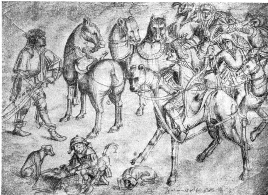
Abb. 1. Reitergruppe.

Die alt-Schweizer Tafelbilder aus der Sammlung Därd, die vor wenigen Jahren in das Museum von Dijon gelangten, sind bereits wiederholt besprochen und in ihrer Bedeutung gewürdigt worden 1) . Besonders die beiden Altarflügel mit der „Anbetung des Kindes“ und dem „Gefolge der heiligen Drei Könige“ wurden in der Literatur verschiedentlich diskutiert 2) . Es ist aber