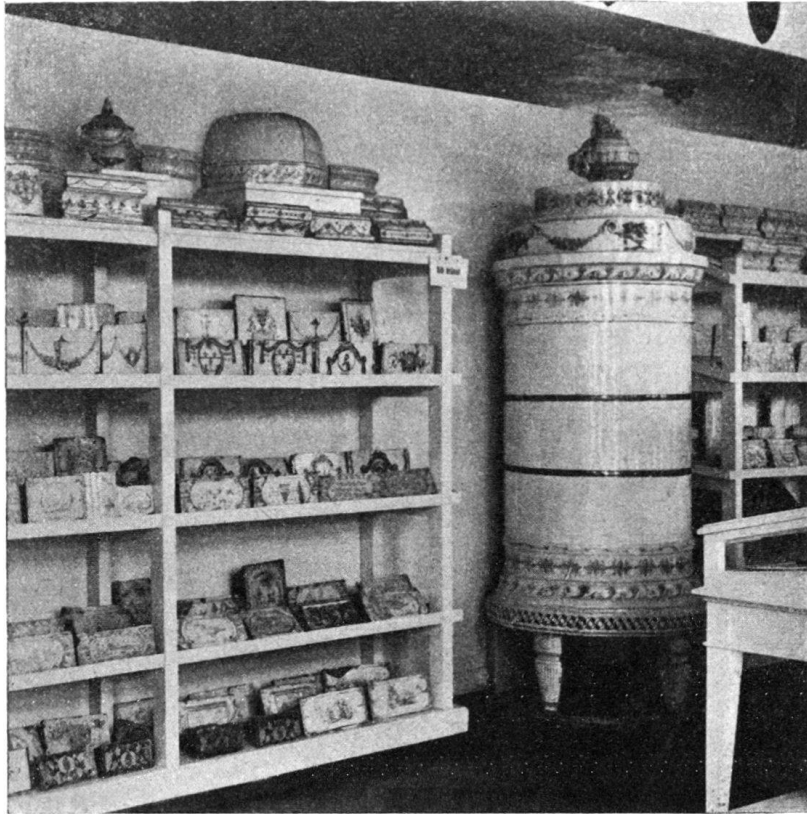
Fig. 3. Keramikabteilung des Hist. Museums Olten.

Münster zu Schaffhausen gegossen hat. Die Sammlung an Zinn und Beleuchtungsgegenständen, die im gleichen Raume mit den kirchlichen Altertümern untergebracht ist, birgt ebenfalls einige wertvolle Stücke, z. B. eine Solothurner Kanne mit Fratze am Ausguß, ein Werk des Zinngießers Graff, und zwei andere, die in der Form an die Basler Ratsherrenkannen des dortigen Zinngießers Linder (um 1650) erinnern. Die Entwicklung der Beleuchtung ergibt sich aus zahlreichen Objekten, angefangen von den primitiven Kienspanhaltern und Talglichtern bis zu den ersten Petrollampen.