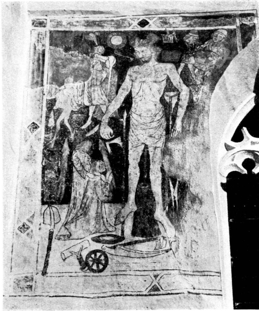
Abb. 3. Waltensburg (Graubünden) Malerei an der südl. Außenwand XV. Jh. Mitte