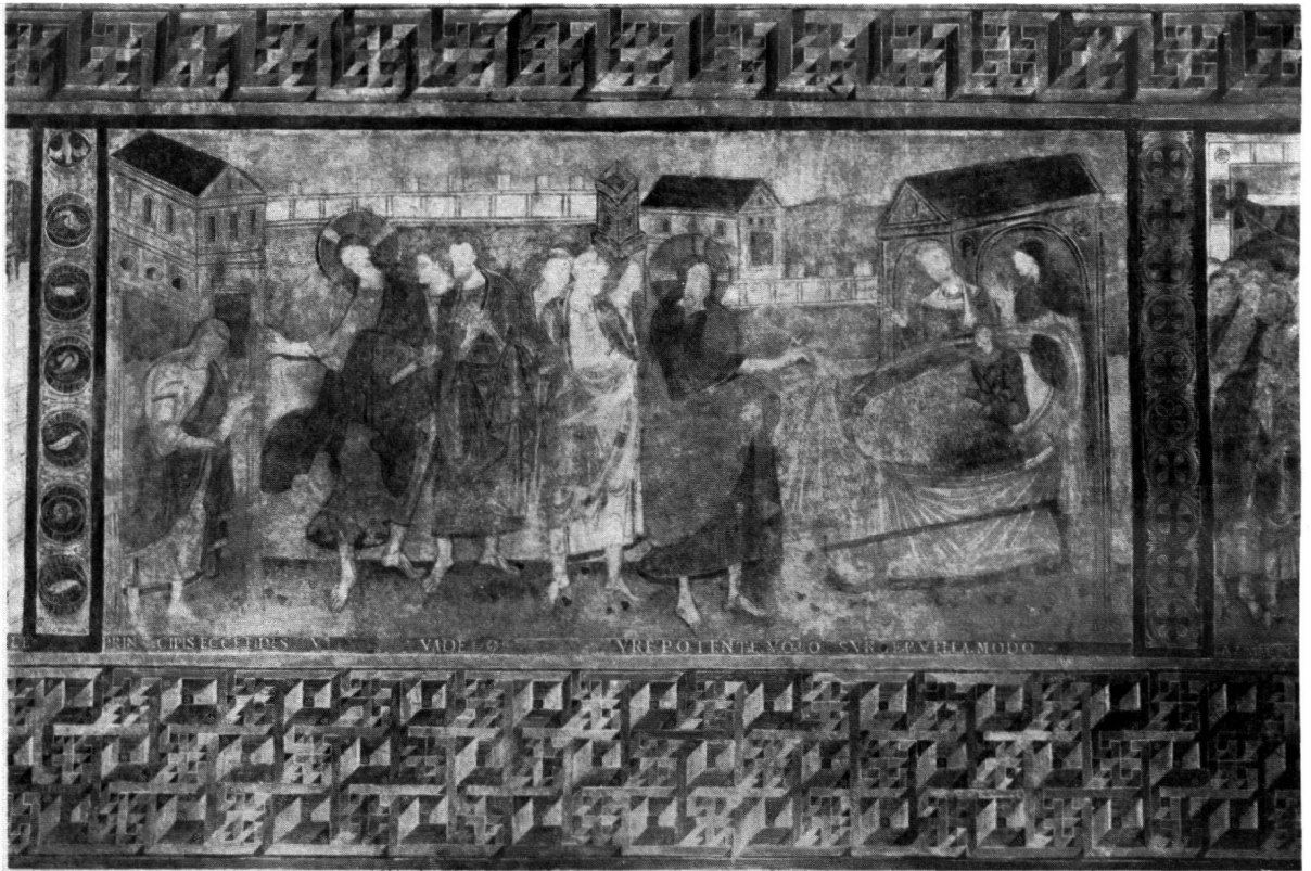
Fig. 8. REICHENAU. FRESQUES DE L'ÉGLISE D'OBERSZELL. LA RÉSURRECTION DE LA FILLE DE JAÏRE