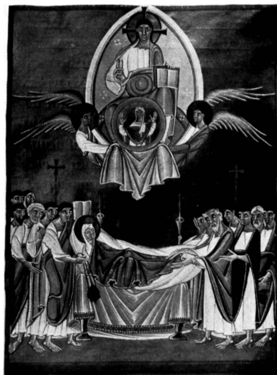
Fig. 7. LIVRE DES PÉRICOPES D'HENRI II LA MORT DE LA VIERGE