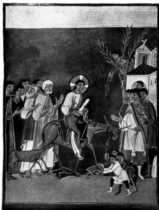
Fig. 6. LIVRE DES PÉRICOPES D'HENRI II L'ENTRÉE DU CHRIST À JÉRUSALEM