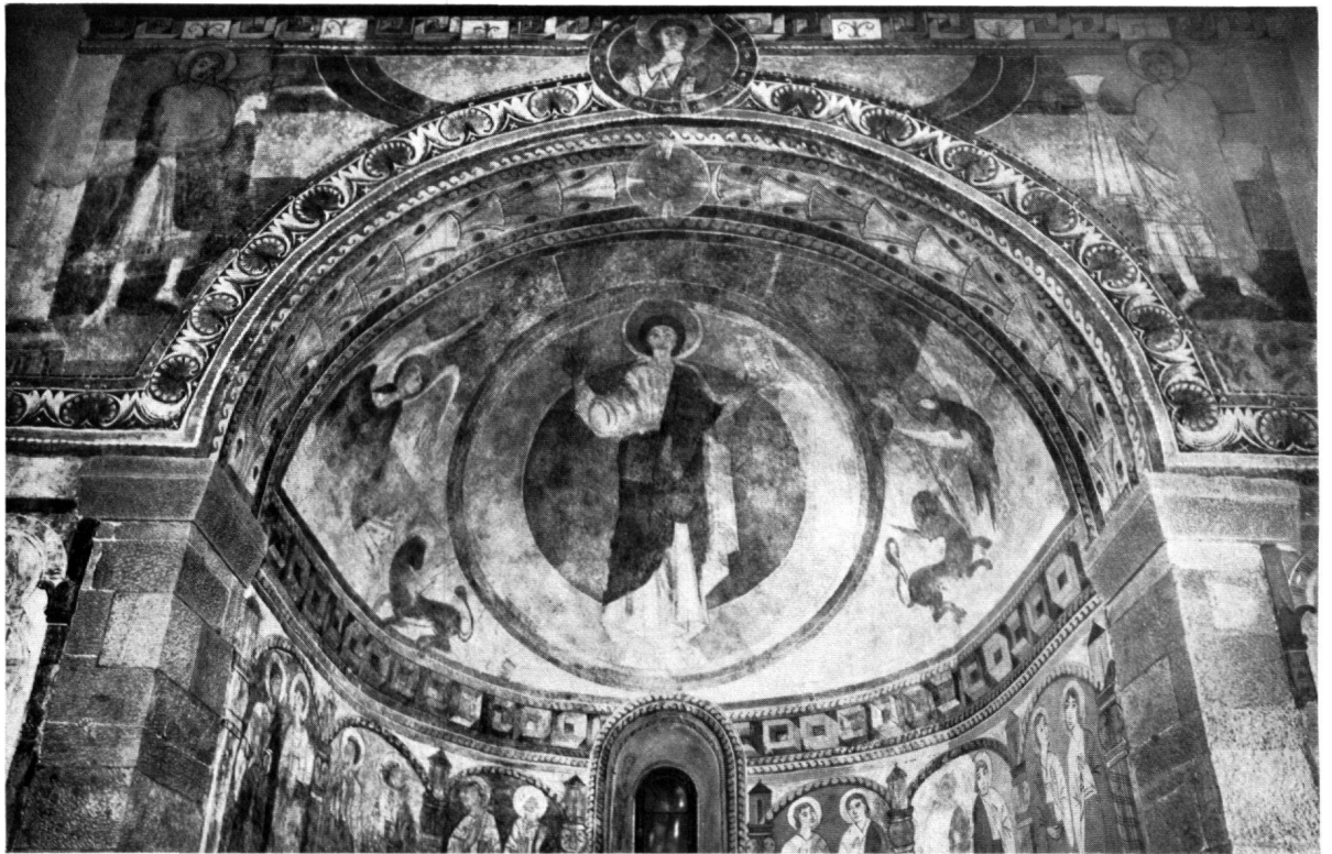
Fig. 2. CHALIÈRES. LE CUL-DE-FOUR ET L'ARC TRIOMPHAL APRÈS LA RESTAURATION