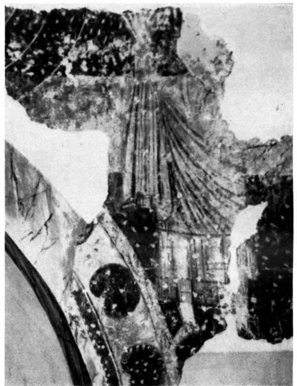
Fig. 10. CHALIÈRES. SAINT JEAN L'ÉVANGÉLISTE (PENDANT LE DÉCAPAGE)