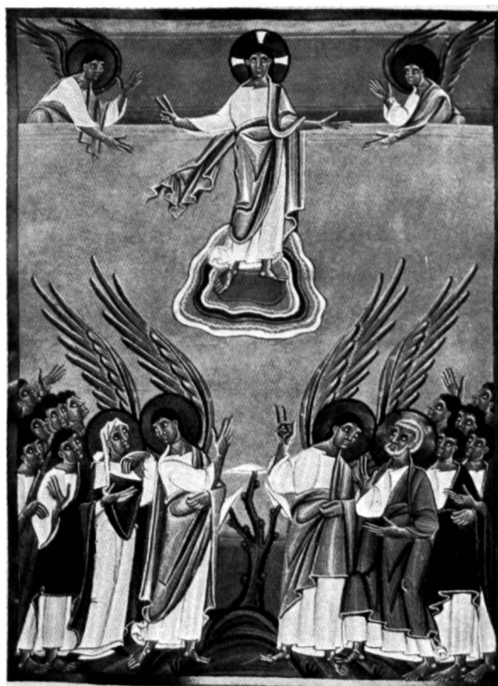
Fig. 5. LIVRE DES PÉRICOPES D'HENRI II L'ASCENSION DU CHRIST