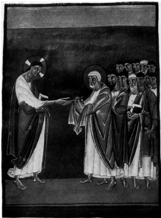
Fig. 9. LIVRE DES PÉRICOPES. LE CHRIST DONNANT LES CLEFS À SAINT PIERRE