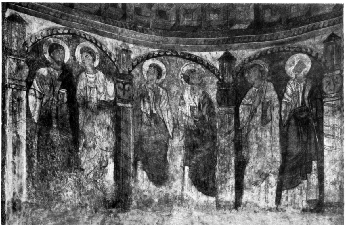
Fig. 3. CHALIÈRES. LES APÔTRES DANS L'ABSIDE (PARTIE GAUCHE) APRÈS LA RESTAURATION