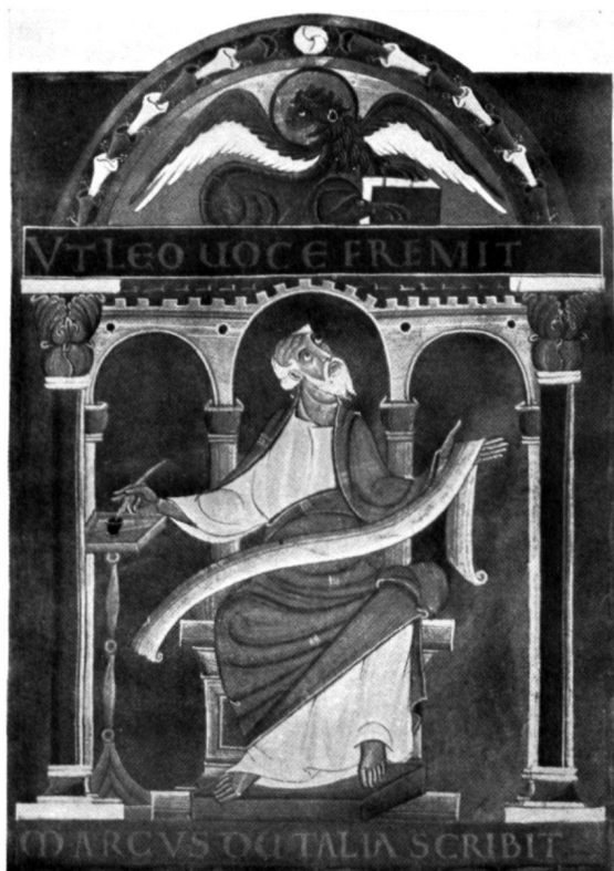
Fig. 4. LIVRE DES PÉRICOPES D'HENRI II SAINT MARC