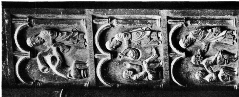
Abb. 3. PARMA, BAPTISTERIUM Werke der Barmherzigkeit (Teilaufnahmen)