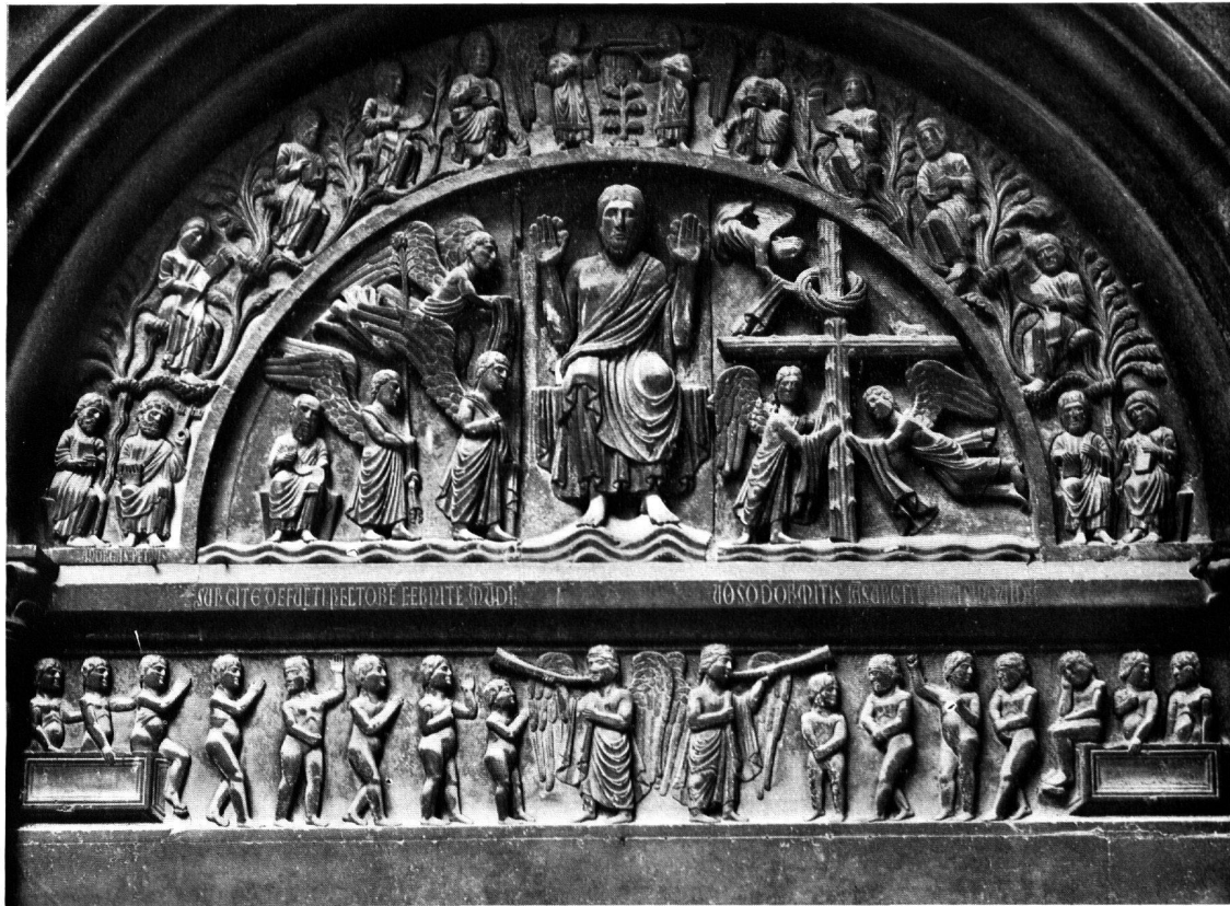
Abb. 4. PARMA, BAPTISTERIUM. TYMPANON, JÜNGSTES GERICHT