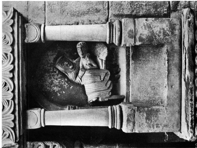
Abb. 2. BASEL, GALLUSFORTE, DETAIL Werke der Barmherzigkeit