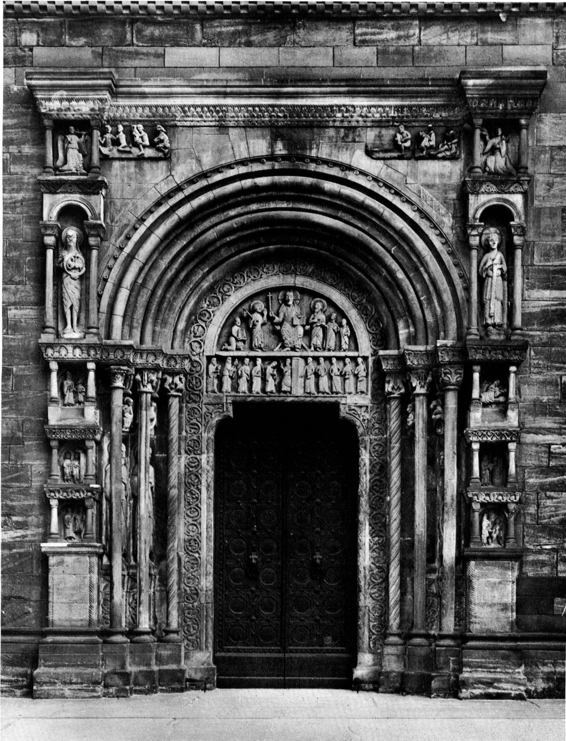
Abb. 1. BASEL, GALLUSPFORTE. GESAMTANSICHT