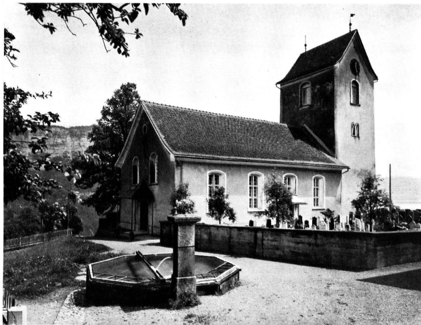
Abb. 1. KIRCHE VON OBSTALDEN, SÜD-WESTANSICHT