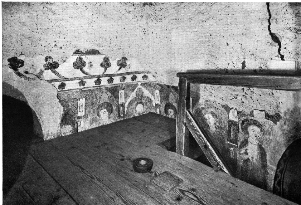
Abb. 3. Nord- und Ostwand. Obere Partie