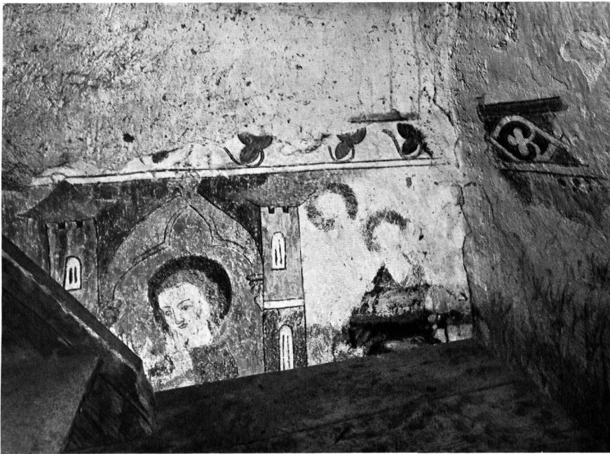
Abb. 5. Ost- und Südwand. Obere Partie