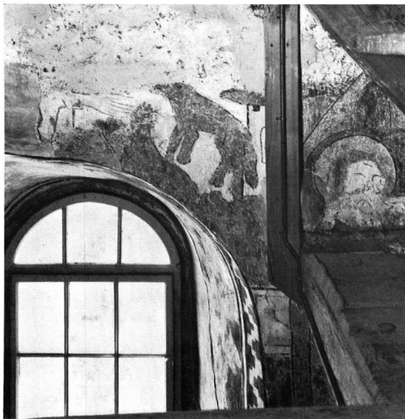
Abb. 7. Fragment über dem Ostfenster