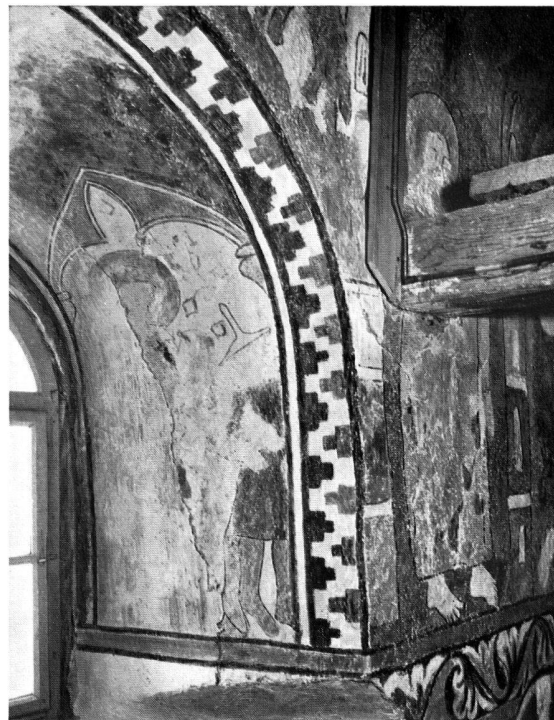
Abb. 8. Südliche Leibung des Ostfensters