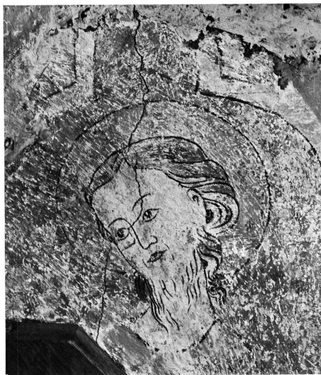
Abb. 9. Detail der Ostwand (s. Abb. 3)

WANDMALEREIEN IM TURMCHOR DER KIRCHE VON OBSTALDEN UM 1320