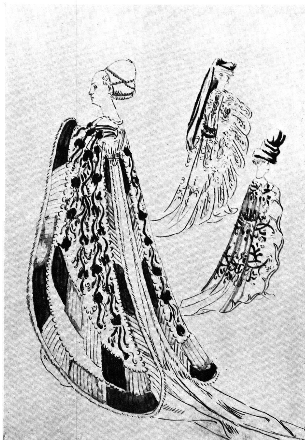
4. Musée Bonnat, Bayonne Nach Bonnat, Les Dessins de la Collection Léon Bonnat GEWANDZEICHNUNGEN VON ANTONIO PISANELLO