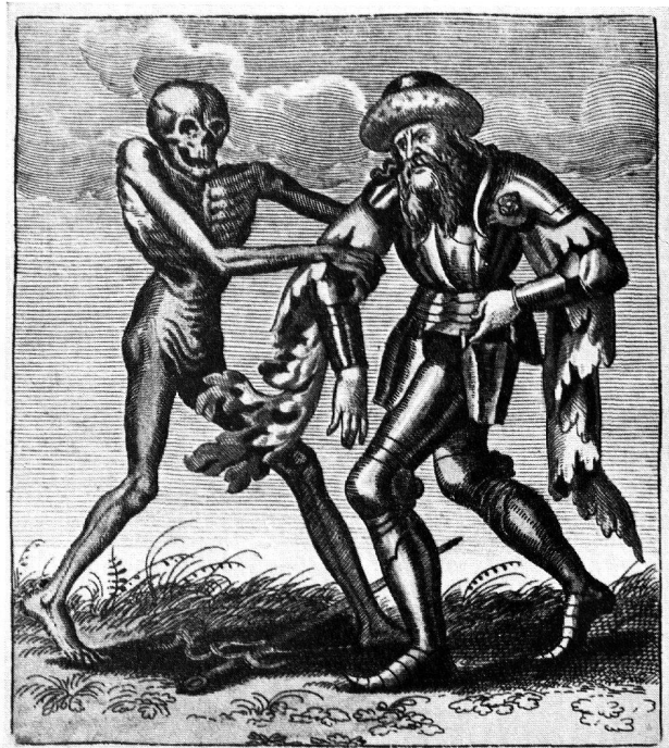
12. TOD ZUM EDELMANN Radierung von M. Merian d. Ä.