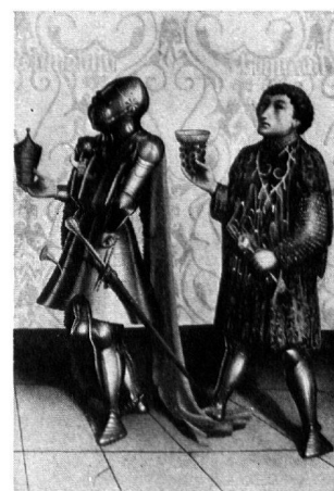
Clichés Verlag Cratander Basel