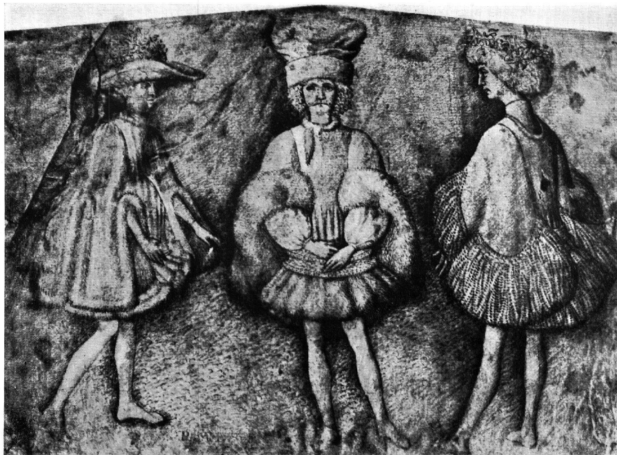
3. Britisches Museum London Nach Degenhart, Antonio Pisanello. Verlag A. Schroll, Wien