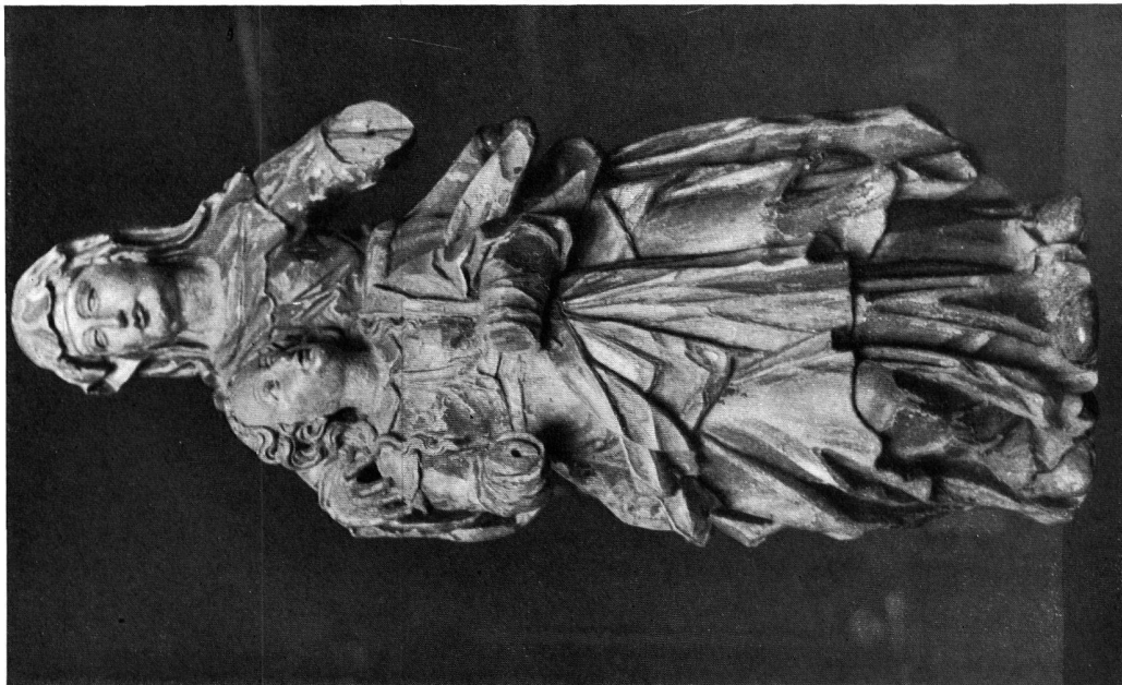
2. HOLZPLASTIK AUS SURSEE