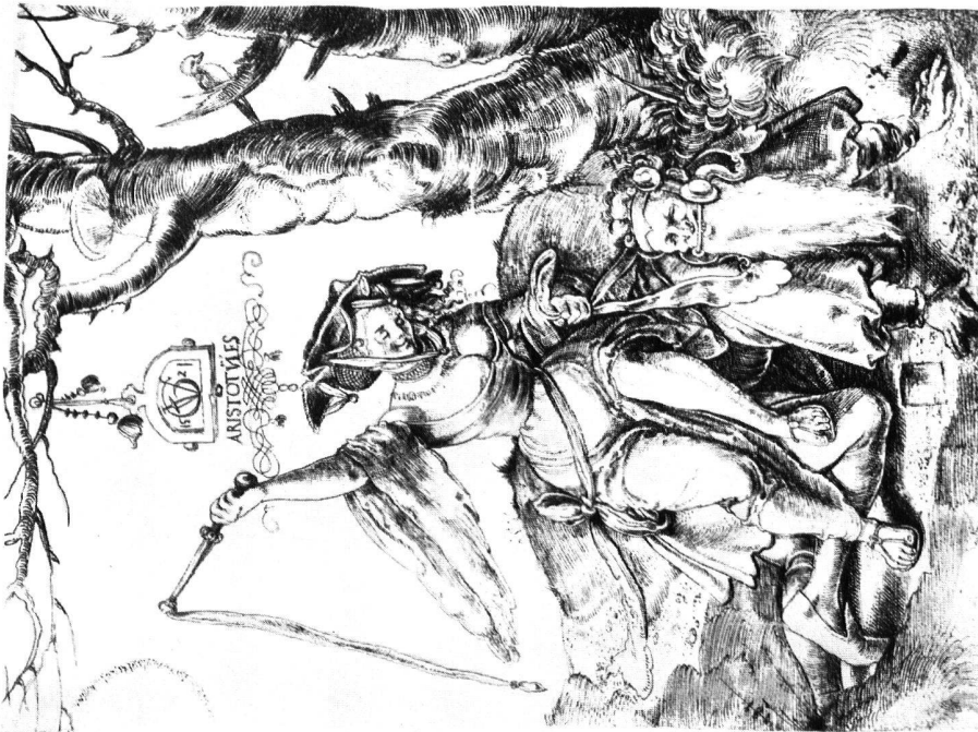
a) Federzeichnung von Urs Graf, 1521 Dessau, Anhaltische Behördenbibliothek (Nach Major-Gradmann, VRS GRAF, Abb. 70)