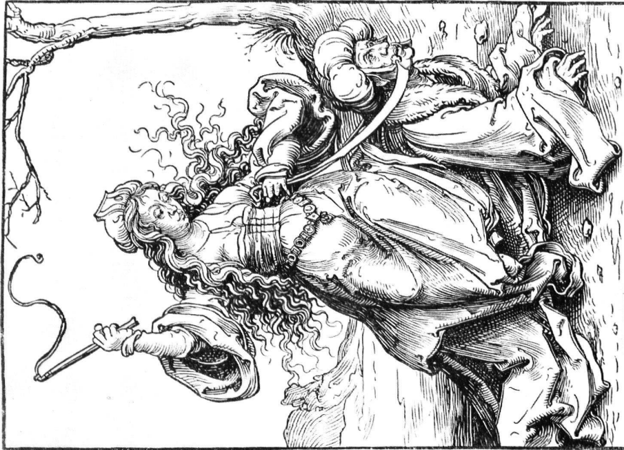
b) Holzschnitt von Lucas von Leyden (Nach Diedrichs, Deutsches Leben der Vergangenheit in Bildern, Band I, Abb. 467)