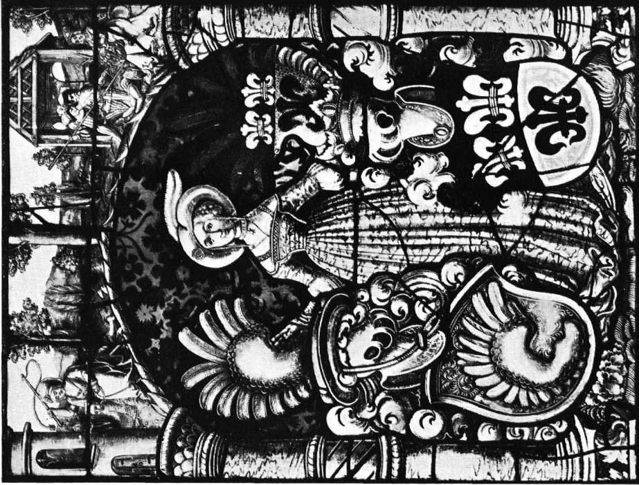
a) Glasgemälde, 1527. Anthoni Glaser zugeschrieben Zürich, Schweiz. Landesmuseum