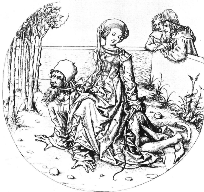
a) Kupferstich vom Meister des Hausbuches Wien, Kupferstichsammlung (Nach Diedrichs, Band I, Abb. 26)