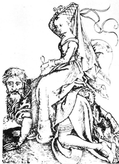
b) Kupferstich von Meister B R – Wien Albertina (Nach Diedrichs, Deutsches Leben der Vergangenheit in Bildern, Band I, Abb. 469)