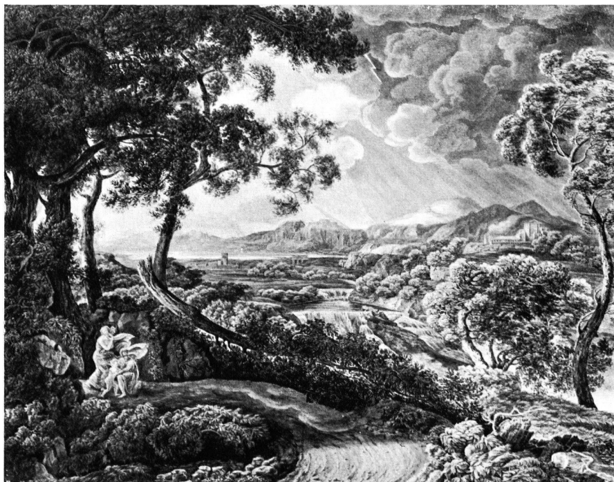
Fig. 3. Kupferstich von G. F. Gmelin nach dem Gemälde von Gaspard Dughet «Il temporale»