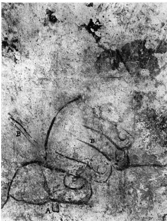
Abb. 3 (links). Kapelle von Schloß Gruyères. Fuß eines Apostels. A: Erhaltene Partien der definitiven Zeichnung. B: Die durchscheinende Vorzeichnung in Tempera, die unter der Einwirkung der Luft und des Kalkgrundes zum Fresko wurde