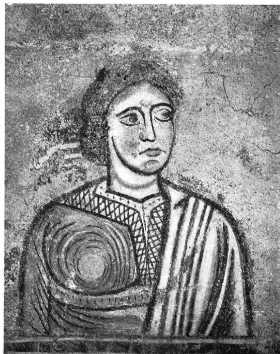
Abb. 8. Kirche von Zillis. Die gleiche Figur nach der zweiten Behandlung und sorgfältiger Entfernung aller noch verbliebenen Mörtelreste