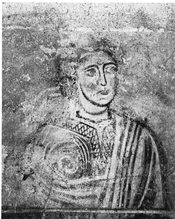
Abb. 7. Kirche von Zillis. Zustand der Malerei nach der ersten ungenügenden Reinigung