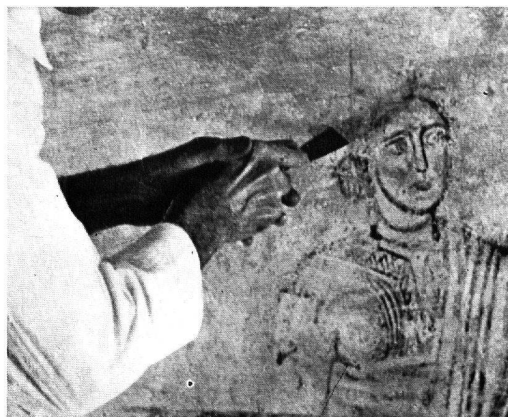
Abb. 4. Kirche von Zillis. Die Abdeckungsarbeit wird unrichtiger Weise mit einem ungeeigneten, zu breiten Instrument durchgeführt