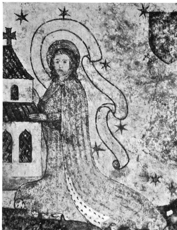
Abb. 6. Kirche von Stein a. Rhein. Die gleiche Partie nach ungenügenden Anhaltspunkten vom Arbeiter frei ausgemalt