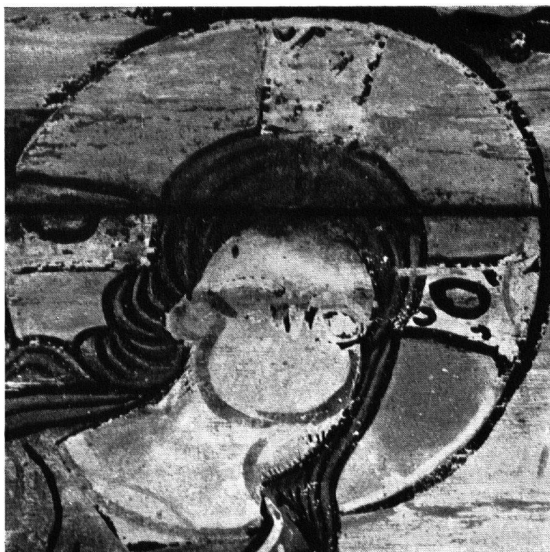
Abb. 1. Kirche von Zillis. Christuskopf mit abgeblätterter Malerei. In der Brust- und untern Gesichtspartie wird die Vorzeichnung sichtbar, die sich nicht mit der definitiven Zeichnung deckt