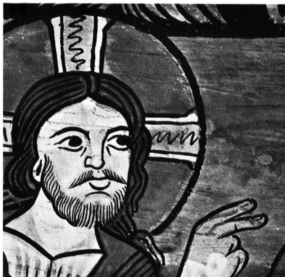
Abb. 2. Kirche von Zillis. Christuskopf mit fast intakter Malerei, nur im Zeig- und Mittelfinger wird die Vorzeichnung sichtbar