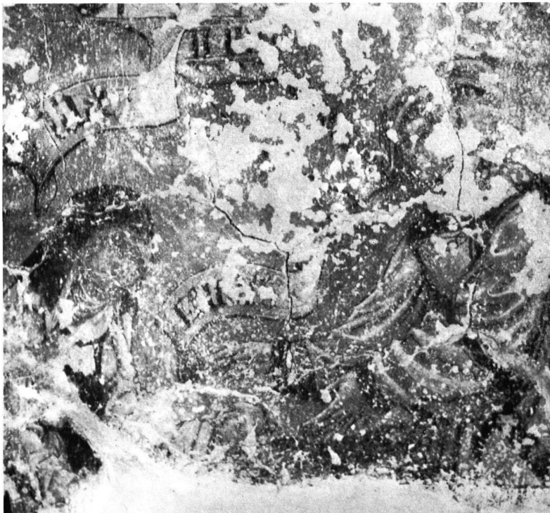
Abb. 10. Die gleiche Partie nach der zweiten vollständigen Reinigung

RESTAURATION VON WANDMALEREIEN Kloster St. Georgen, Stein a. Rhein. Untere Abtstube