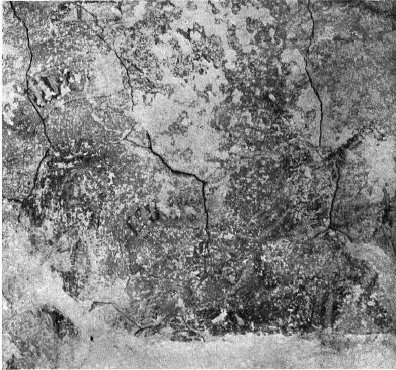
Abb. 9. Teil der Wandmalerei nach der ersten ungenügenden Reinigung