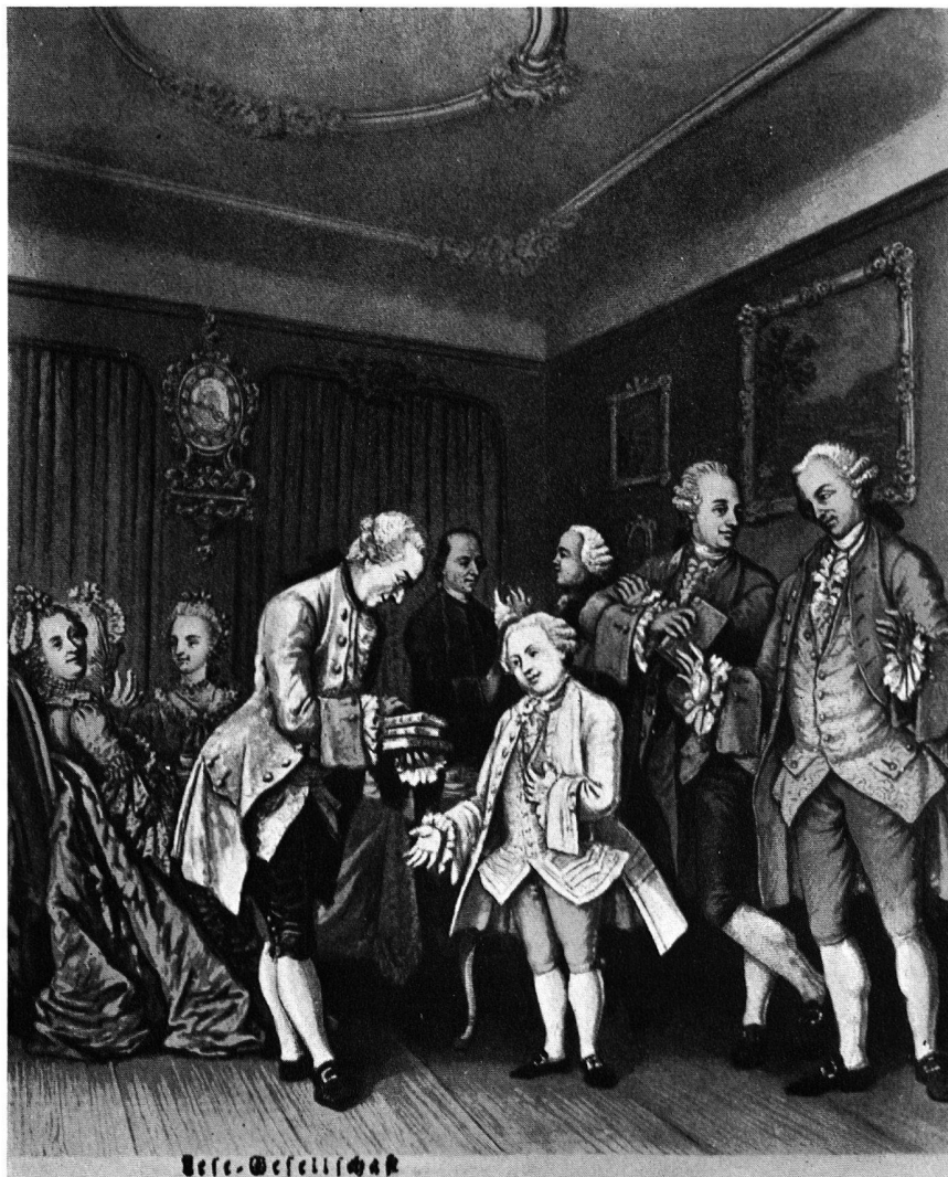
Abb. 3. AQUATINTABLATT VON FRANZ HEGI, 1832 Salomon Geßner übergibt am 3. Oktober 1766 seine 4bändigen gesammelten Schriften dem kleinen Wolfgang Amadeus Mozart