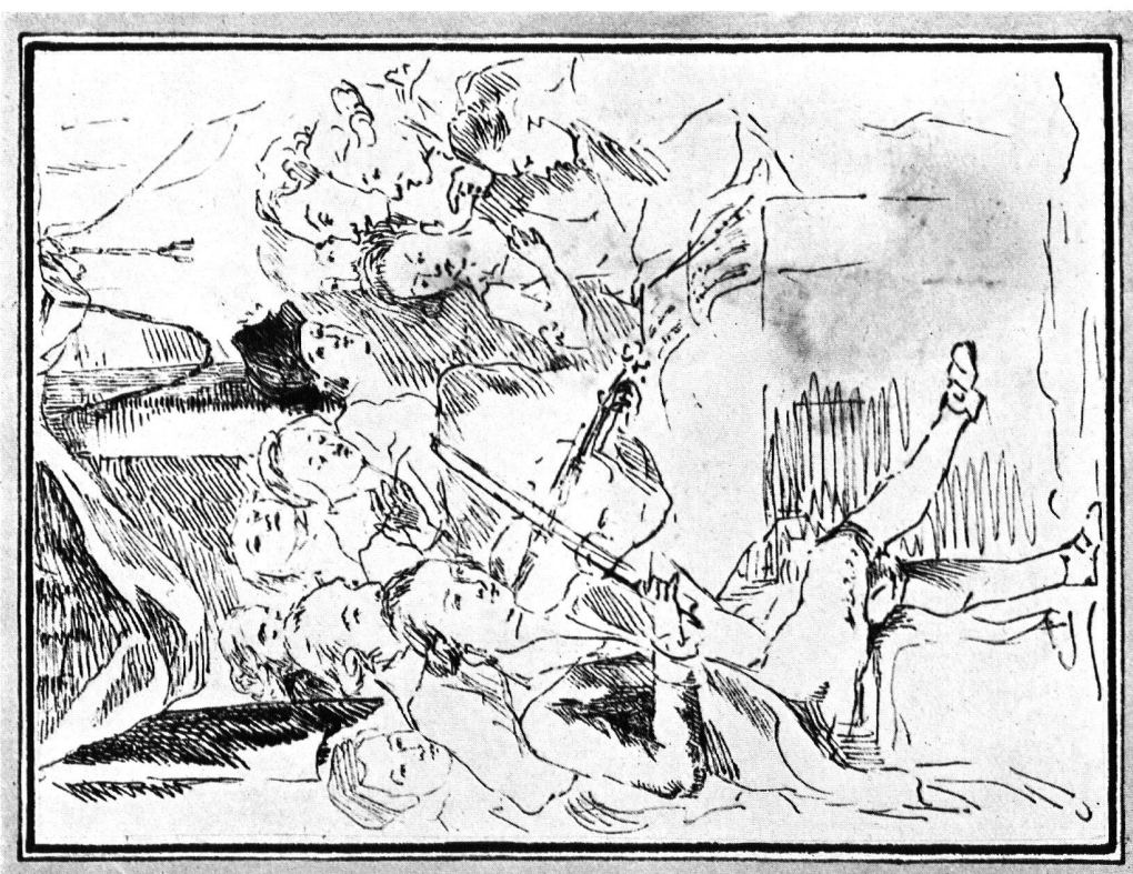
Abb. 1. Wolfgang Amadeus Mozart musiziert in kleiner Gesellschaft, wahrscheinlich im Hause des Salomon Gefner Federzeichnung von Salomon Gefner. Basel, Kupferstichkabinett