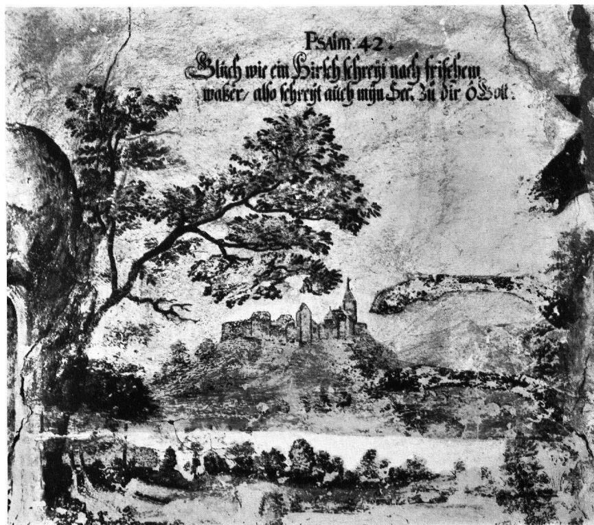
Detail mit Ansicht des Städtchens Regensberg