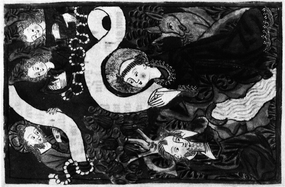
3 Das Quellwunder