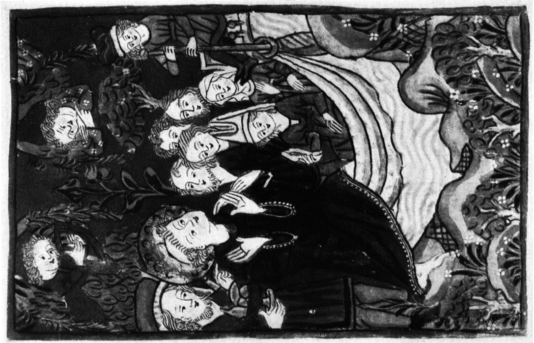
4 Die Einschiffung nach Ancona

MINIATUREN AUS EINER FRANZISKUS-VITA, 2. HÄLFTE 15. JH.