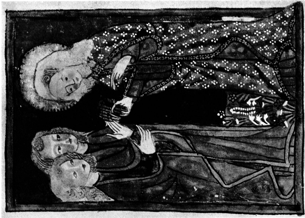
6 Miniatur aus einer Legende Johannes des Evangelisten (205:135 mm)