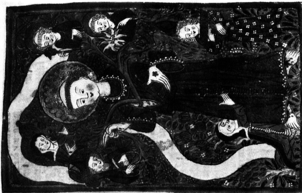
2 Der hl. Franziskus mit den Wundmalen