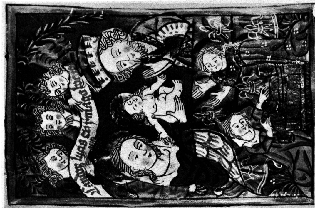
5 Miniatur aus einer Legende der hl. Clara. Geburt der Heiligen (150:110 mm)