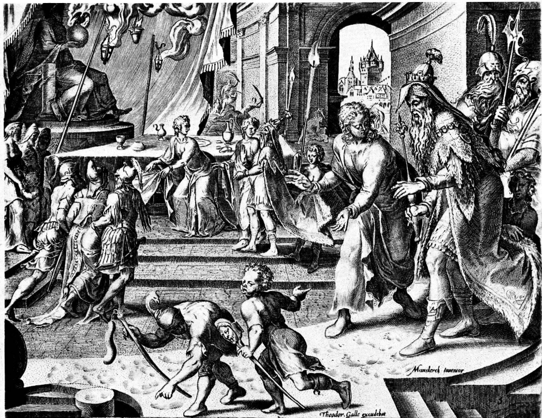
3 Daniel beneficio cribrati cineris interitum sacerdotum machinatur.

Maarten Heemskerck Inceptor Hieronymus Cock excudit