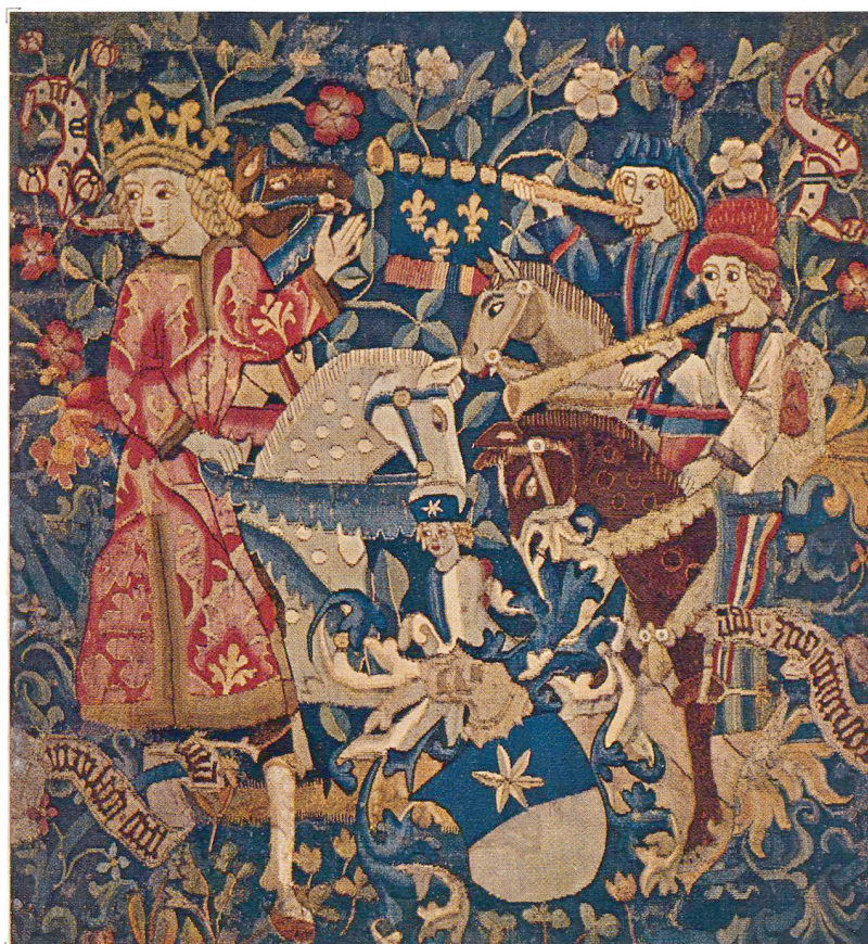
Abb. 1. Bildteppich mit Wappen der Berner Familie v. Bubenberg. Um 1470. H. 90 cm, Br. 83,5 cm. Zürich, Schweizerisches Landesmuseum. Inv. Nr. LM25116

glaubt an eine Entstehung im Elsass 3 . Er scheint dieses Fragment nie im Original gesehen und auch nicht die Farben des Wappens gekannt zu haben, denn sonst wäre seine Zuschreibung an die Familie Zorn von Dunsenheim, die einen weissen Stern vor rotem Grunde in ihrem Wappen führt, nicht vorgekommen. Da er im Glauben war, dass es sich um eine Wirkerei aus dem Besitze einer elsässischen Familie handelte und der Teppich in der Tat auch figürliche Analogien und mit