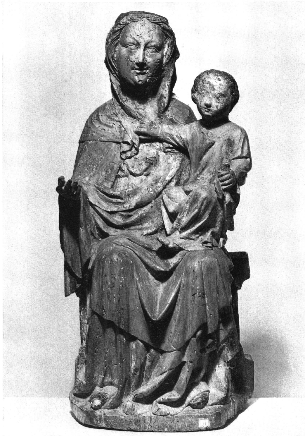
Vierge à l'Enfant, premier tiers du XVI e siècle. Bois de tilleul avec traces de polychromie. Hauteur 76 cm. Acquisée chez un collectionneur de St-Ursanne qui l'avait découverte à Courgenay