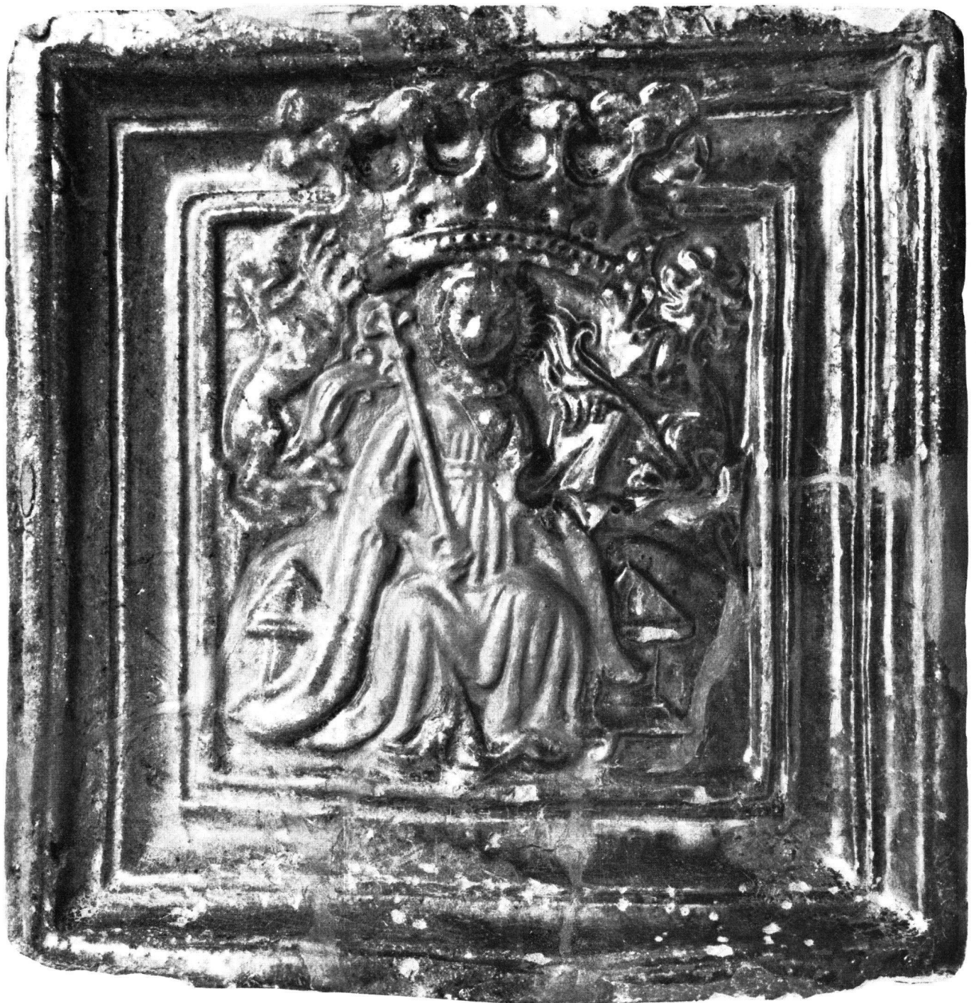
Abb. 1 Ofenkachel mit reliefierter Darstellung einer Regentin. H. 21,1 cm, B. 20,7 cm. Um 1444. Vom Lindenhof in Zürich Schweizerisches Landesmuseum (LM 26417-1)

ließen es, wider die Anordnungen der österreichischen Hauptleute, bei St. Jakob an der Sihl zu einem offenen Treffen kommen, das von den Eidgenossen leicht gewonnen wurde. Gerold Edlibach erzählt, wie man in Zürich nach dem unglücklichen Ausgang der Schlacht