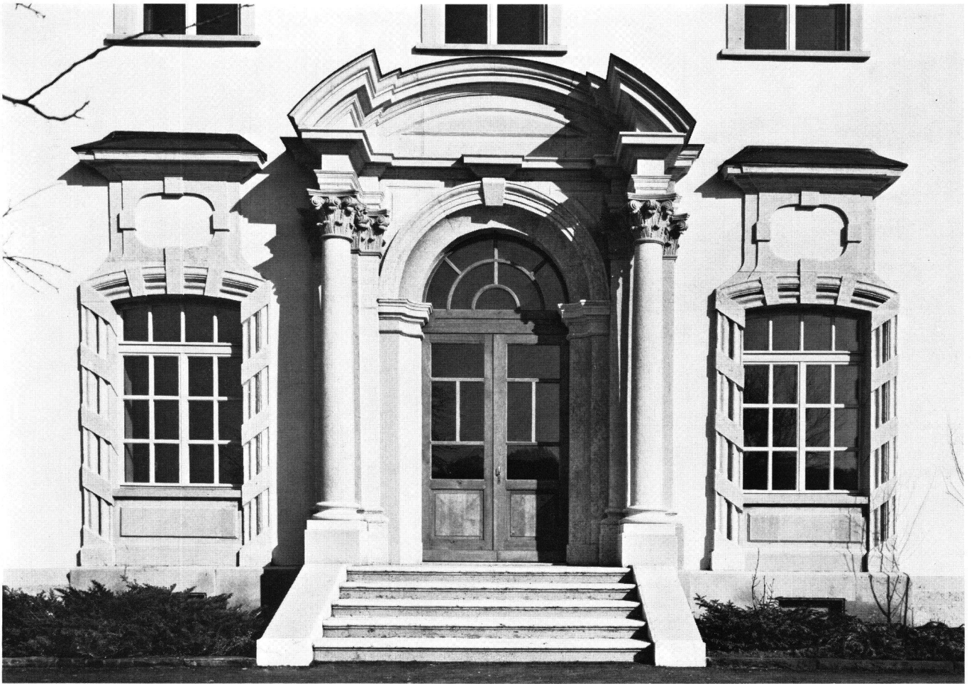
Abb. 2 St. Urban, ehemaliges Klostergebäude, Hauptportal an der Westfassade

Dienerchaft beschloß den Zug. Man zählte über 60 Pferde – ein Maß, an dem damals Größe und Wichtigkeit eines Zuges gemessen wurde.