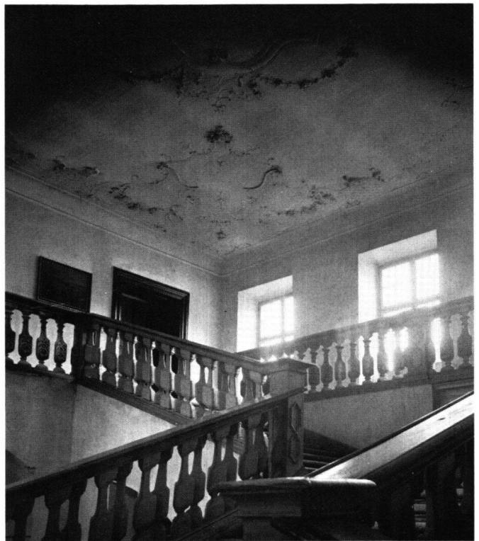
Abb. 4 St. Urban, ehemaliges Klostergebäude, Treppenhaus im Mitteltrakt

Wie erwähnt, konnte auch die Visite mit einer Abholung verbunden sein, wenn es um ein besonderes Ereignis ging wie beispielsweise den Akt der Burgrechtserneuerung, der zur Hauptsache in einem offiziellen Besuch des Abtes beim versammelten Rat bestand. So schritt am Tage nach der Schultheißensvisite eine feierliche Abholungsdelegation paarweise gegen das Hotel Falken, wo Abt Martinus abgestiegen war: 4 Herren des täglichen und 4 Herren des großen Rates, der Großweibel, der Gerichtsschreiber und der als Zeremonienmeister amtierende Rathausamann sowie eine stattliche Zahl von Staatsdienern. Sie schickten einen Läufer voraus und wurden pünktlich von Prior und