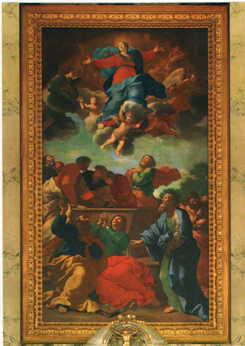
Abb. 1 Giovanni Francesco Romanelli, Himmelfahrt Mariä. 1644/45. Hochaltarblatt der St.-Galler Stiftskirche. Öl auf Leinwand, 6,2 × 3,5 m.

des Toggenburger Landvogts Hans Rudolf Reding eine Anzahl von Soldaten, die im Spätsommer 1643 abreisen. Gleichzeitig bemüht sich Abt Pius, den von Venedig in der Eidgenossenschaft angeworbenen Söldnern den Durchpaß durch das sanktgallische Gebiet zu verwehren und auch die katholischen Orte der Innerschweiz im gleichen Sinne zu beeinflussen, im Falle von Schwyz allerdings vergeblich 12 . Der Castro-Krieg endet für die Kurie mit einer politischen und militärischen Niederlage. Der Herzog von Parma geht als moralischer Sieger aus der Auseinandersetzung hervor.