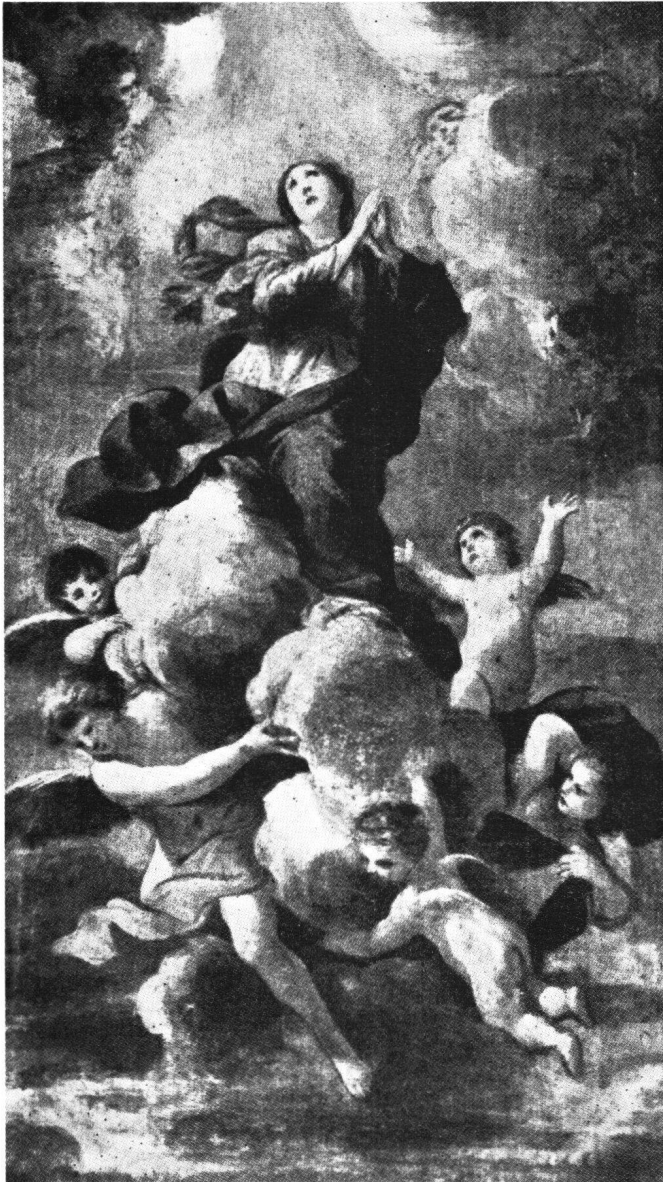
Abb. 4 Giovanni Francesco Romanelli, Assumpta. Bozzetto in der Collezione Marchesi Incisa della Rocchetta, Rom, zum 1638/39 entstandenen zentralen Deckenfresko in der Sakristei der Römer Kirche S. Maria dell'Anima.