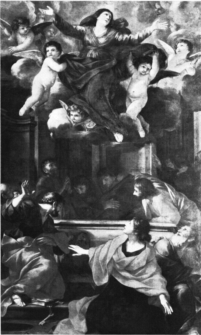
Abb. 7 Giovanni Francesco Romanelli, Himmelfahrt Mariä. Ca. 1648/49 gemalt für die Kirche S. Rocco, Viterbo. Heute im Museo Civico, Viterbo. 3,08 × 1,80 m. Im Gegensatz zum St.-Galler Werk hält hier Romanelli den Augenblick unmittelbar nach dem Verlassen des Grabes fest. Auch sonst weist das Gemälde Unterschiede zum St.-Galler Altarblatt auf.

Aufnahme Mariens in den Himmel ist ganz eingeordnet in die Darstellung des religiösen Erlebnisses der Beteiligten. Die Dynamik des heiligen Geschehens erscheint zurückgebunden in Blicke und Gebärden. Rein kompositorisch ist das Werk trotz allem Pathos gekennzeichnet durch eine gewisse Statik und distanzierte Verhaltenheit, die der klassizistischen Tendenz Romanellis entspringen. Die Intensität der leuchtenden, klaren Farben gemahnt an Poussin. Ob in diesem Punkt gewisse Begegnungen mit dem französischen Meister während dessen Rom-Aufenthalts in den späten zwanziger und den dreißiger Jahren den jungen Romanelli entscheidend prägten, bleibe da-