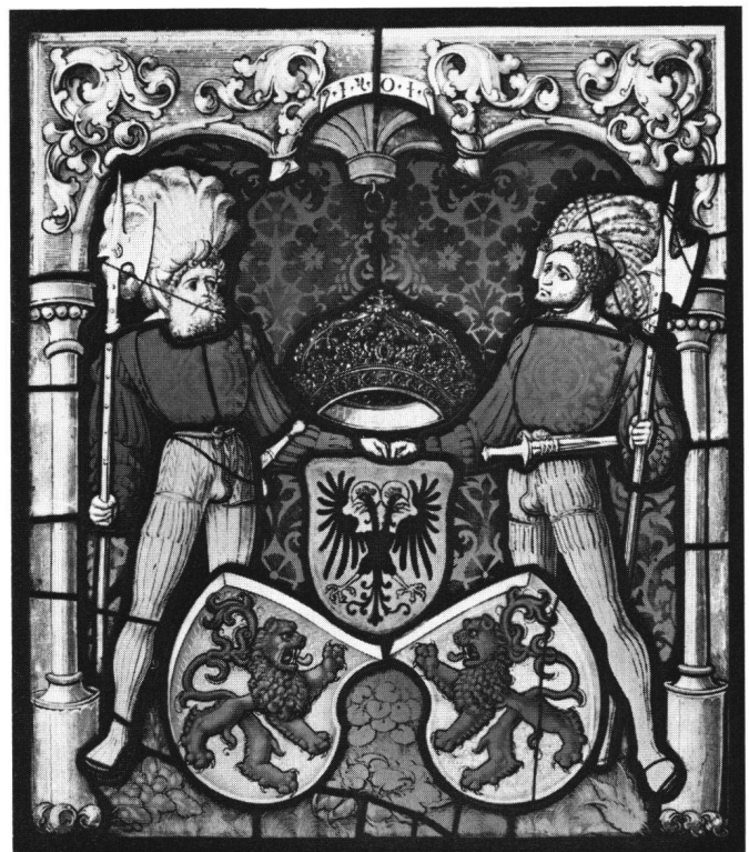
Abb. 3 Hans Funk: Stadtscheibe von Bremgarten. Bernisches Historisches Museum.