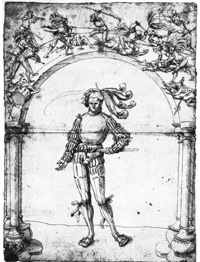
Abb. 1 Niklaus Manuel: Eidgenosse unter einem Bogen mit Kampfszenen. Kupferstichkabinett des Kunstmuseums Basel.

Die Schlachtszenen in den Oberlichtern stehen im Zusammenhang mit einigen kurz zuvor oder gleichzeitig entstandenen Holzschnitten. Für die Gruppierung in Zweikämpfe (Abb. 1) drängt sich als nächstes bedeutsames Vorbild der Riesenholzschnitt mit der Darstellung der Schlacht bei Dornach auf, in dem zahlreiche derartige Gruppen zu finden sind 6 . Eine entsprechende Schlächtereier am Burghügel von Dornach hat der Illustrator der um 1500 entstandenen Chronik des Nikolaus Schradin wiedergegeben (Abb. 4) 7 . Von diesem Holzschnitt der Schradin-Chronik mag Manuel nicht nur zur Auflösung des