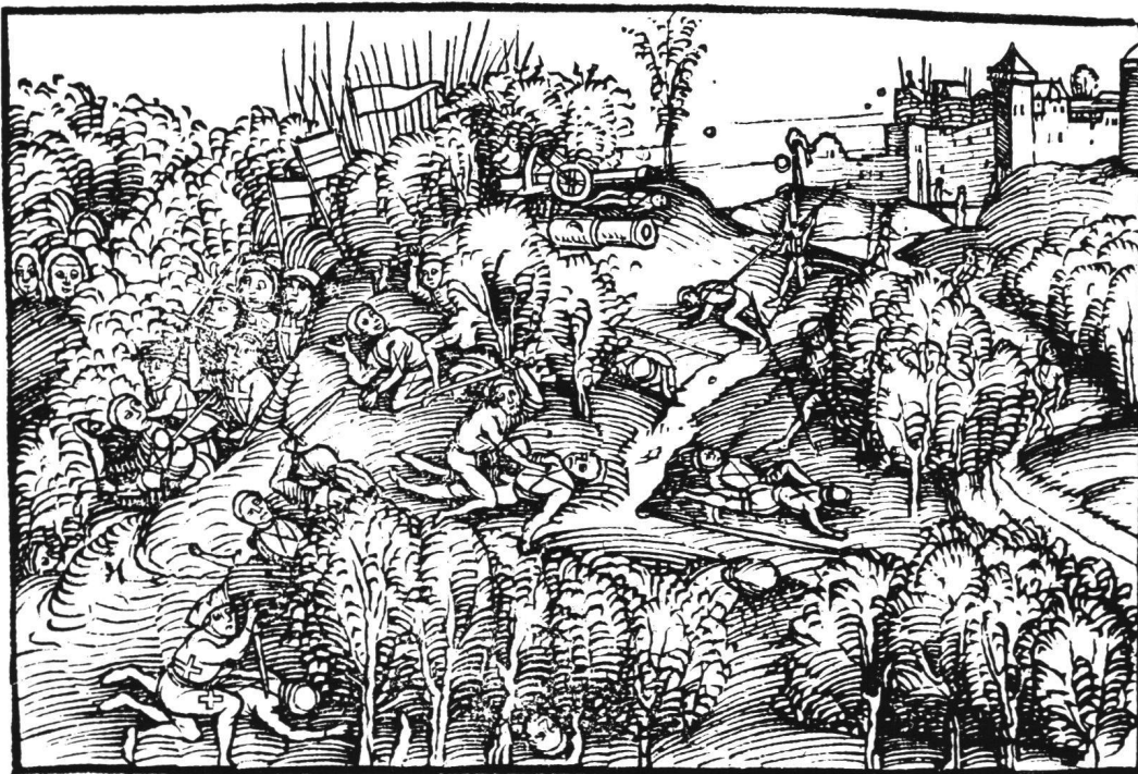
Abb. 4 Unbekannter Illustrator: Kämpfe vor dem Schloß Dornach. Illustrationsholzschnitt in der Chronik des Nikolaus Schradin.

Abschließend stellt sich die Frage, wodurch Manuel zu seiner kritischen Betrachtungsweise des zeitgenössischen Schweizers angeregt worden sein könnte. CÄSAR MENZ hat kürzlich die Narrenschelle am Barett des Reisläufers in der Zeichnung «Rückenfigur eines Eidgenossen» in Zusammenhang mit dem «Narrenschiff» des Sebastian Brant gebracht 16 . Diese Darstellung des Eidgenossen als