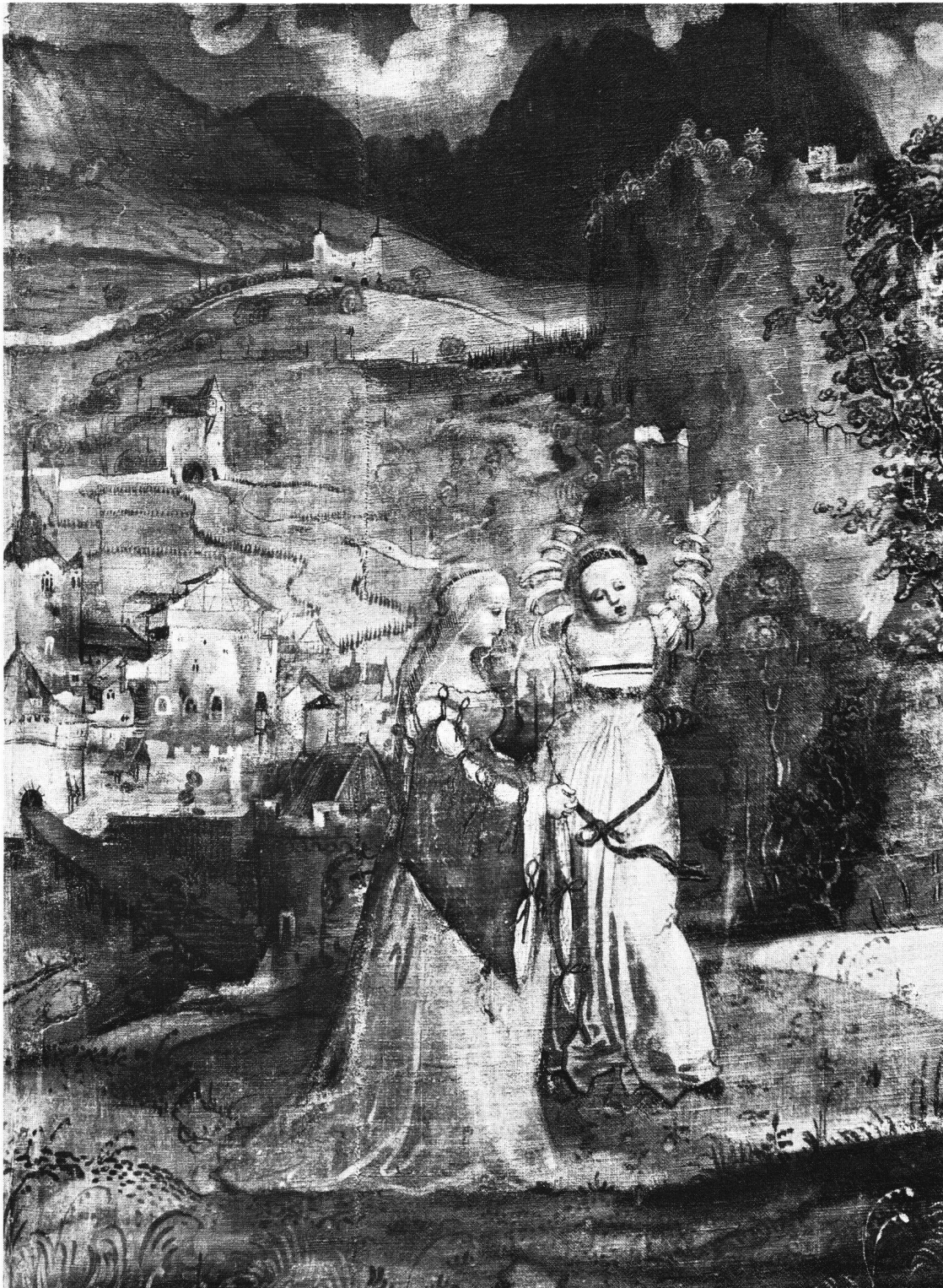
Abb. 8 Niklaus Manuel: Pyramus und Thisbe (Detail). Kunstmuseum Basel

genössischen Kraftprotzerei bewahrt und ihm das Bewußtsein für die Eitelkeit und die Allgegenwart des Todes mitgegeben. Schönstes Zeugnis für die historische Urteilskraft Frickers ist seine Beschreibung des Twingherren-