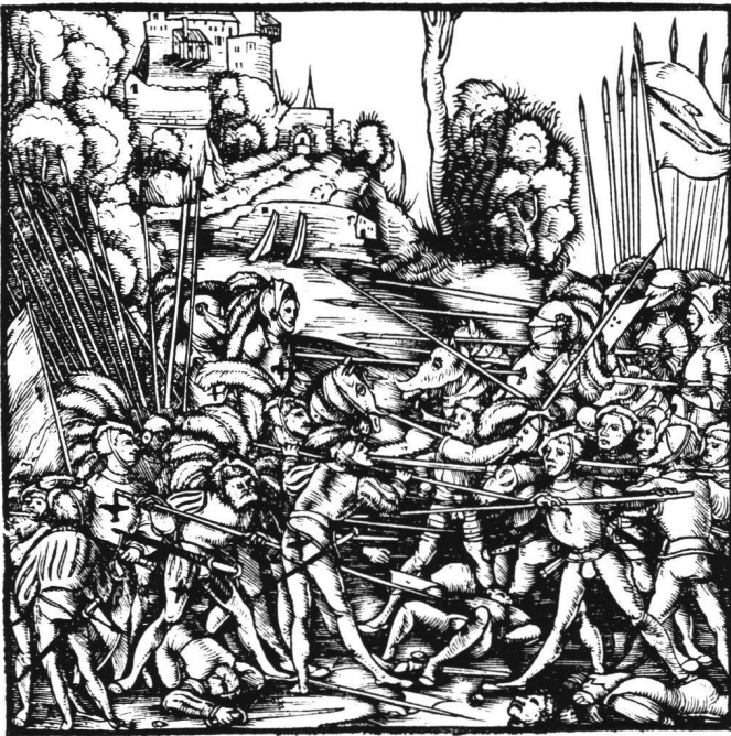
Abb. 5 Unbekannter Illustrator: Schlacht mit Langspießen. Illustrationsholzschnitt in der Chronik des Petermann Etterlin.