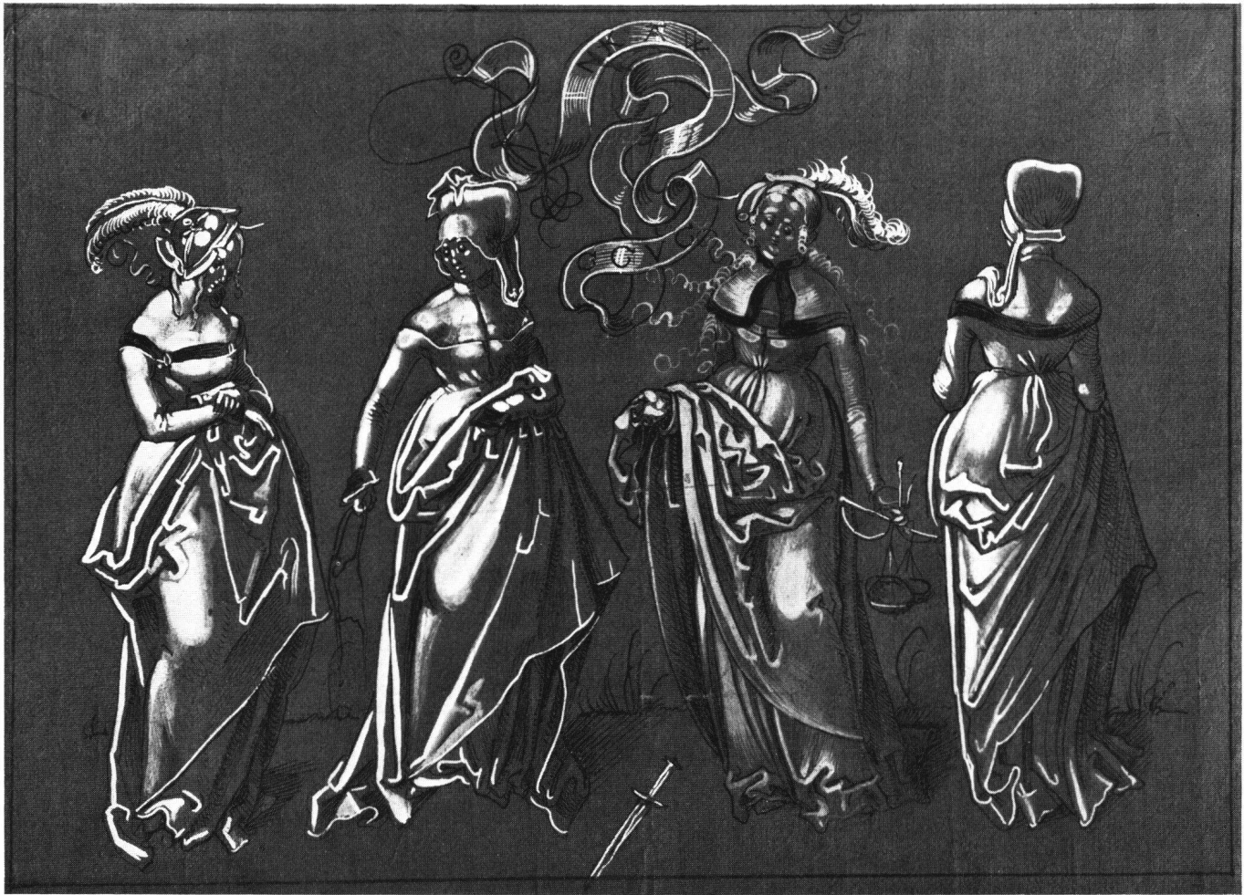
Abb. 7 Niklaus Manuel: Vier allegorische Frauengestalten . Helldunkelzeichnung. Staatliche Kunsthalle Karlsruhe.

den, ist auch sein Blatt mit Kostüm- und Bewegungsstudien (Abb. 7) reich an allegorischer Bedeutung. Die zwei mittleren Figuren sind Anspielungen auf die Weibermacht und die unkeusche Liebe. Die Figur links von der Banderole hält eine Unterhose, ein Kleidungsstück, das in der allegorischen Bildsprache des ausgehenden Mittelalters als Zeichen der männlichen Vorherrschaft verstanden wurde, denn zur weiblichen Garderobe gehörte es damals noch nicht. Wie man noch heute unter Ehepartnern scherzhaft unterscheidet, welcher von beiden «die Hosen trägt», so amüsierte man sich schon im 14. und 15. Jahrhundert in deutschen Volkserzählungen und in der Graphik über den Ehestreit um die Herrschaft im Hause, der als Kampf um eine Hose dargestellt wurde. Üblicherweise trug die Frau den Sieg davon, wie zum Beispiel in einem Kupferstich des Israhel van Meckenem angedeutet wird (LEHR 504 «Kampf um die Hose 44 »). In Urs Grafs Zeichnung einer herrschsüchtigen Ehefrau, umringt von fünf Putten 45 , hängt die erkämpfte Hose wie ein Siegesbanner am Stecken, der von einem Putto-Fähnrich emporgehalten wird. Von den restlichen Putten richtet