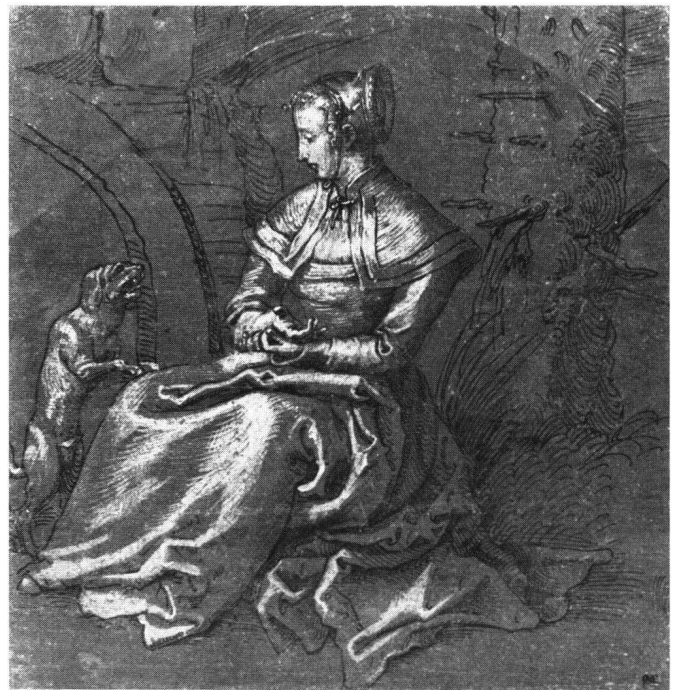
Abb. 1 Niklaus Manuel: Frau mit Hund . Helldunkelzeichnung. Städelsches Kunstinstitut Frankfurt.

der Frau 1 schon andeutungsweise auf die Absicht des Blattes eingegangen ist, bleibt noch manches ungeklärt. Mittelpunkt der Aussage dieser Zeichnung ist der spannungsgeladene Kontakt zwischen Frau und Hund. Unbekümmert blickt sie das energisch bellende Tier an. Die Bedeutung dieser Begegnung erklärt sich aus den symbolischen Vorstellungen, die man in Manuels Generation mit Hunden assoziierte. Damals galt das Tier in bezug auf eine Frau unter anderem als Sinnbild des Liebhabers 2 oder der Geilheit schlechthin 3 . Aus diesem Zusammenhang heraus wurde auch der Hundebiß als Metapher des Geschlechtsverkehrs 4 verstanden. Deshalb erscheint oft in bildlichen Darstellungen von Liebespaaren ein Hund neben der meist sitzenden umworbenen Frau. Ein typisches Beispiel dieser Gattung liefert ein Bildteppich, um 1400 in Arras entstanden 5 , auf dem ein Herr mit zärtlicher Gebärde einer sitzenden Dame sein Herz anbietet. Wie die Gefühle des Verliebten durch das überreichte Herz versinnbildlicht werden, so wird auch sein erotisches Interesse an der Dame durch den sie anbellenden Hund ausgedrückt. Auch im graphischen Werk des Meisters BR mit dem Anker findet sich diese Symbolik. In seinem