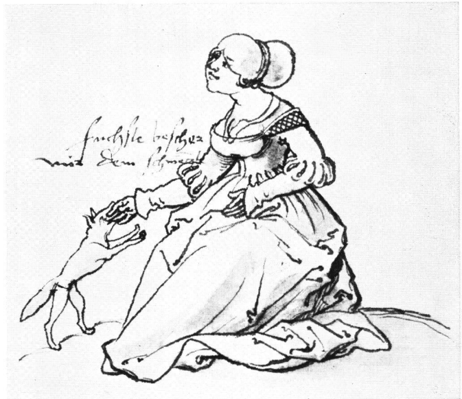
Abb. 2 Anonym süddeutsch: Frau mit Fuchs . Federzeichnung. Universitätsbibliothek Erlangen.

alle Einzelheiten dieser Symbolik zusammen. Unterhalb der Abbildung eines modernen «ungleichen Paares» – eines alten Jägers und der von ihm umarmten jungen Geliebten – stehen folgende Verse: «In meinen jungen Jahren / da ging ich oft zum Wild / die Schnepfe dort zu jagen / wie hab ich dann geknallt! / Wie stieß ich gern und mächtig / den Ladstock in den Lauf / Wie stand der Hund so prächtig / wenn's auf die Sau ging drauf / ... Die Jagd, die ist geschlossen / verrostet ist's Gewehr / das Pulver ist verschossen / Der Hund, der steht nicht mehr!»