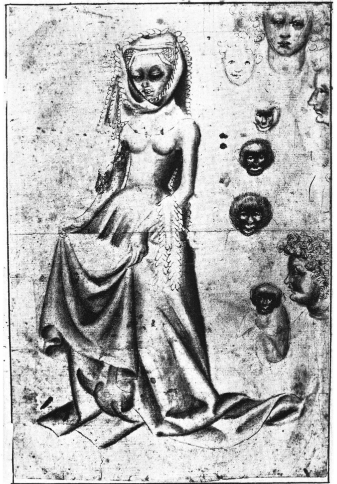
Abb. 13 Anonym österreichisch: Skizzenbuchblatt . Federzeichnung. Germanisches Nationalmuseum Nürnberg.

ihren Schoß zeigt. Auf einem weiteren Blatt Grafs 56 zu diesem Thema dient der erhobene Rock dem Anbieten von Äpfeln, eine Geste, die im 16. Jahrhundert ebenfalls als erotische Einladung verstanden wurde 57 . Die Frau mit Äpfeln fordert den Betrachter auf, Sinnesfreuden zu genießen, bevor sie durch das unaufhaltsame Verrinnen der Zeit verblichen sind, eine Aussage, die das « carpe diem -Motiv» der Sonnenuhr auf dem Boden betont. Die Gebärde des erhobenen, mit Früchten gefüllten Rockes verwandte auch Lukas Cranach in seinem Porträt einer Kurtisane 58 , um auf unmißverständliche Art ihre Stellung am sächsischen Hof zu kennzeichnen. Die Gebärde des Rockhebens, auch ohne die symbolischen Früchte, wurde offenbar schon im 14. Jahrhundert als Liebesangebot aufgefaßt, denn es kommt schon im Skizzenbuch des Samuel Pepys vor 59 . Dort rafft eine stehende Dame ihre Rockfalten zusammen und hält sie dem neben ihr sitzenden, begierig auf ihren Schoß blickenden Freier entgegen. Das Interesse der Männer an dieser Gebärde zeigt auch ein Skizzenbuchblatt aus Österreich (Abb. 13), auf dem