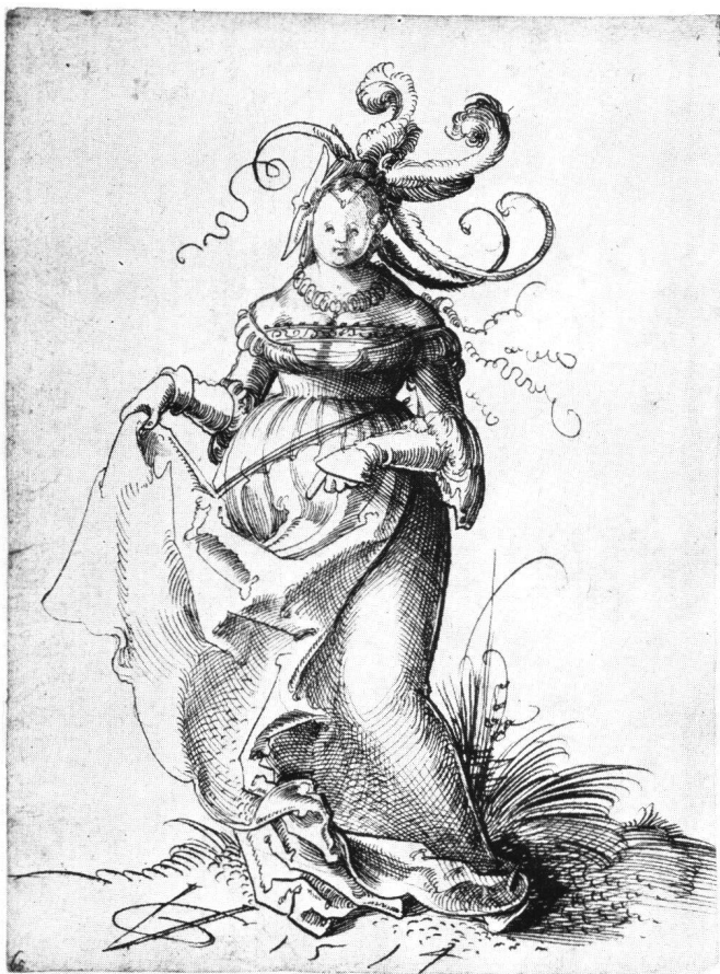
Abb. 12 Urs Graf: Dirne zeigt in den Schoß , 1514. Federzeichnung. Kupferstichkabinett der Öffentlichen Kunstsammlung Basel.

In Manuels Holzschnitt (Abb. 11) offenbart die angeblich kluge Jungfrau mit hochgehaltener Lampe ihre in Wahrheit lasterhaften Absichten durch die Gebärde des Rockanhebens. Diese galt als Aufforderung zum Liebesgeuß, wie aus zahlreichen Beispielen in Literatur und Kunst hervorgeht. Im 16. Jahrhundert sagte man von einer Frau, die unerlaubte Liebschaften unterhielt, daß sie «ihren Rock anbietet» oder «den Rock verleiht 55 ». Die anzügliche Bedeutung der Geste verdeutlicht die unge-nierte, ihren Rock emporhaltende Dirne in einer Zeichnung Urs Grafs (Abb. 12), indem sie mit der Linken auf