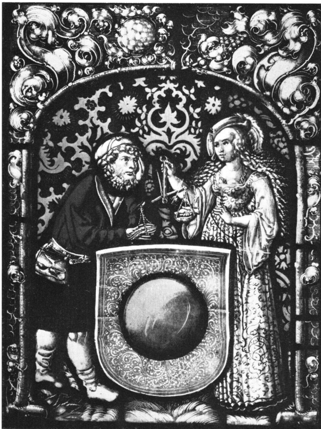
Abb. 9 Anonym schweizerisch: Ungleiches Paar mit Wappenschild . Glasgemälde. Schweizerisches Landesmuseum Zürich.