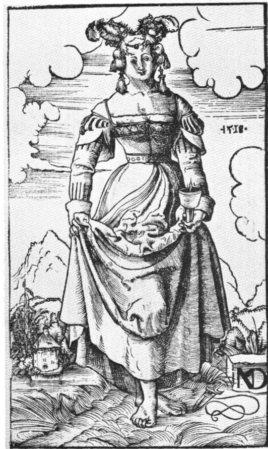
Abb. 11 Niklaus Manuel: Kluge Jungfrau , 1518. Holzschnitt. Herzog Anton Ulrich-Museum Braunschweig.

anmutenden Behandlung des Themas waren schon ähnliche Beispiele vorausgegangen. Schon um 1513 hatte Manuel in einer Kreidezeichnung die Gleichgültigkeit einer Törichten gegenüber dem entronnenen Öl dargestellt 51 . Den Eindruck des Unbeteiligtseins erweckt auch die Jungfrau in einer Zeichnung Urs Grafs 52 . Trotz ihres guten Willens, welchen die Inschrift auf ihrem Mieder verkündet, und obwohl sie ihre Lampe redlich hochhält, wird dennoch das Öl, wie von einer übernatürlichen, schicksalhaften Macht, in die Luft gesogen 52a . Das ikonographisch Unbestimmte an dieser Figur, die wie eine kluge Jungfrau aussieht und doch keine ist, findet sich in weniger humorvoller Form bei Niklaus Manuel wieder. Wie HANS CHRISTOPH VON TAVEL gezeigt hat, ist in Manuels Holzschnittzyklus der Unterschied zwischen Klugen und Törichten gänzlich verwischt 53 . Jedoch bezieht Manuel die Jungfrauen nicht nur der Torheit und der Eitelkeit, wie VON TAVEL nachweisen konnte, sondern auch der Unkeuschheit. Dies läßt sich an der Gebärde des Rockhebens (Abb. 11) und an der symbolischen Bedeutung des Öls ablesen. Wiederum knüpft Manuel an ältere Traditionen an. Schon im 12. Jahrhundert wurde das Öl in der Lampe als Sinnbild der Tugend und Keusch-