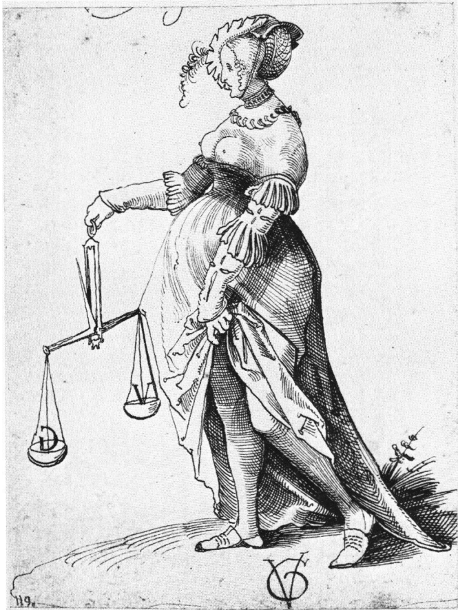
Abb. 10 Urs Graf: Dirne mit Waage . Federzeichnung. Kupferstichkabinett der Öffentlichen Kunstsammlung Basel.

Metapher der Minne-Ikonographie übernommen, sie aber dem ursprünglichen Sinn entfremdet, um mir ihr ein pikantes, vielleicht selbstironisches Bild einer geschäftlich versierten Dirne zu gestalten.