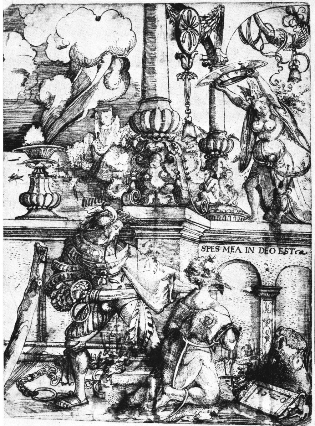
Abb. 14 Kopie nach Urs Graf: Enthauptung Johannes des Täufers , 1520. Federzeichnung, Fürst von Thurn und Taxis, Regensburg.

zwei Männerköpfe im Profil der den Rock lüpfenden Frau aufmerksam zuschauen. Daß die hohle Falte des erhobenen Kleides hier nicht ausgefüllt wurde, mag andeuten, daß die Gebärde mit oder ohne Früchte gleichermaßen verständlich war. Niklaus Manuel verwandte das Gebärdenmotiv nicht nur im Holzschnitt von 1518, um die Unkeuschheit einer Frau zu offenbaren, die sich als kluge Jungfrau ausgibt, sondern auch in einem der etwa gleichzeitig entstandenen «Schreibbüchlein». Wie bei anderen Kostümstudien 60 , so bereichert Manuel auch in die-