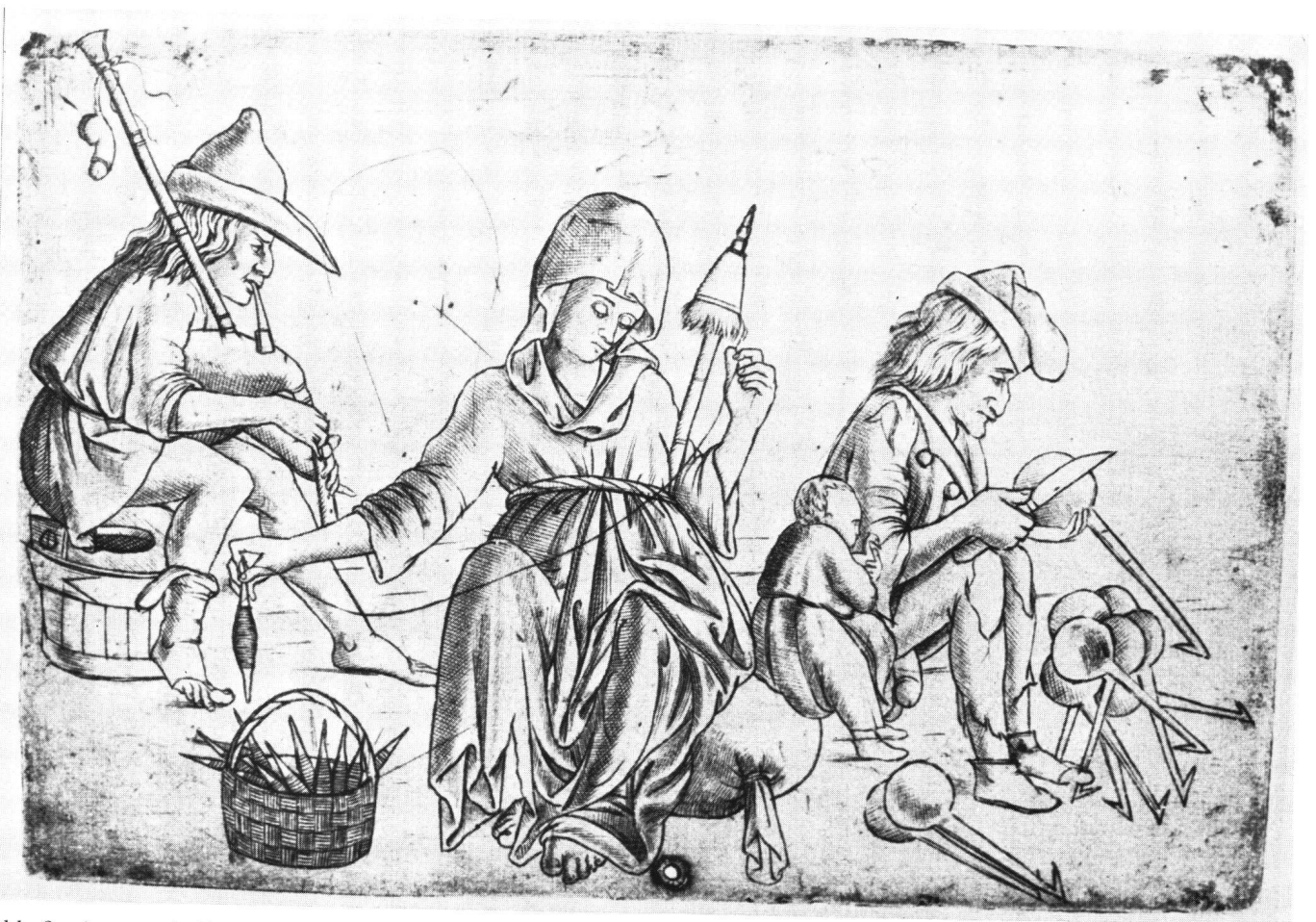
Abb. 3 Anonym italienisch: Allegorische Tätigkeiten . Kupferstich. British Museum London.

In seiner Zeichnung einer nackten jungen Frau mit einem Spinnrocken in der Linken, die unter einer Banderole vor braunschwarz getuschem Hintergrund steht 25 , bedient sich Niklaus Manuel ebenfalls der geläufigen erotischen Metaphern- und Gebärdensprache seiner Epoche. Hinsichtlich der Technik erinnert der dunkle Hintergrund, der die Figur reliefartig hervortreten läßt, an Dürers Proportionsstudien 26 , jedoch hat HANS CHRISTOPH