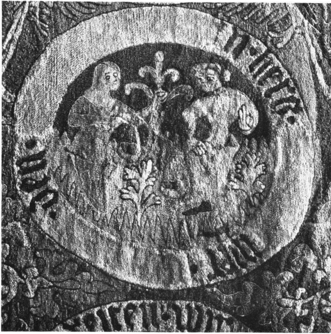
Abb. 8 Minnetepich , um 1360. Ausschnitt. Stadtmuseum Regensburg.