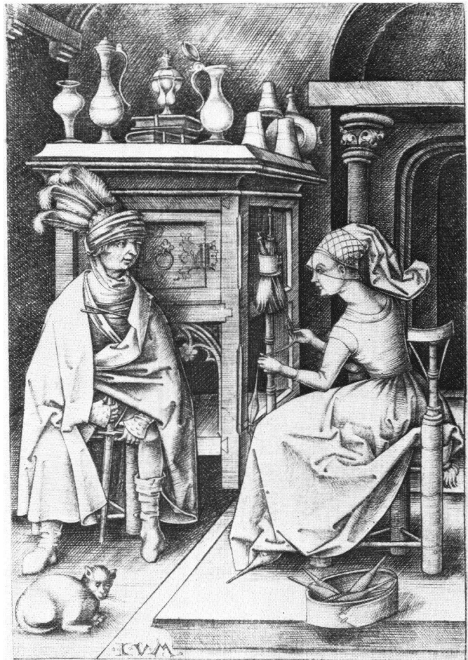
Abb. 4 Israhel van Meckenem: Der Besuch bei der Spinnerin . Kupferstich. Kunstsammlungen der Veste Coburg.

Frauen verfallen ist. Zahlreich erscheinen auch Spinnstuben 39 in der deutschen Graphik und angewandten Kunst dieser Epoche und bezeugen den zugleich anstößigen und moralisierenden Ton, der bei populären Kunstgattungen, die zweierlei Absichten dienen, nicht außergewöhnlich war.