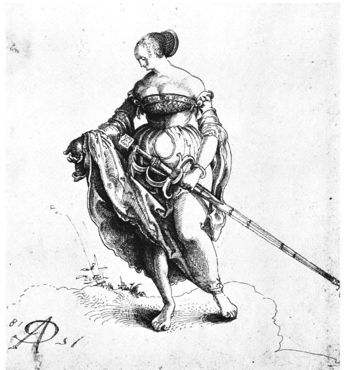
Abb.6 Urs Graf: Werbende Dirne , 1518. Federzeichnung. Kupferstichkabinett der Öffentlichen Kunstsammlung Basel.

Ähnlich wie Manuels Aktzeichnungen mit tuschierten Hintergründen, die ihre Funktion als Aktstudie mit beziehungsvollen Aussagen zum Thema der Frau verbind-