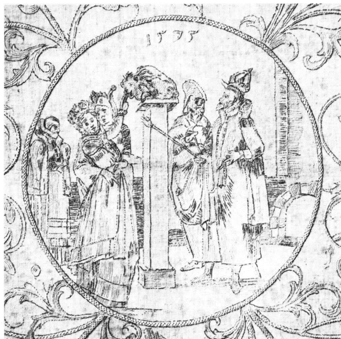
Abb. 3 Leinenstickerei mit «Bocca della Verità»-Darstellung (Virgils Ehebrecherfalle), 1575. Zustand vor der Reinigung. [AG 2390]

Beispiel 3 betrifft eine Leinenstickerei von 1575 (Abb. 3). Sie wies überall Stockflecken und in den mittleren Partien dunklere, gelbbraun gefärbte, scharf umrandete Flecken auf. Während das Stück ausgestellt war, schienen sich einige der Flecken zu verändern. Das gab Anlaß, die Natur der Flecken zu untersuchen. Gemäß dem Prinzip des kleinstmöglichen Eingriffs beschränkte sich die Untersuchung auf Randpartien außerhalb der Stickereimotive, wo sich in der Tat Pilzbefall nachweisen ließ. Wir schlugen vor, das Stück mit einem milden Bleichmittel zu behandeln. Bereits beim Einweichen in Wasser zeigte sich, daß im Bereich der dunkel verfärbten Partien sich mehrere fünflliber große Stellen auflösten und Löcher entstanden. Die mikrochemische Untersuchung an einzelnen Fasern der Lochränder erwies, daß die Leinenfaser erhebliche Mengen von Eisenoxid enthielt.