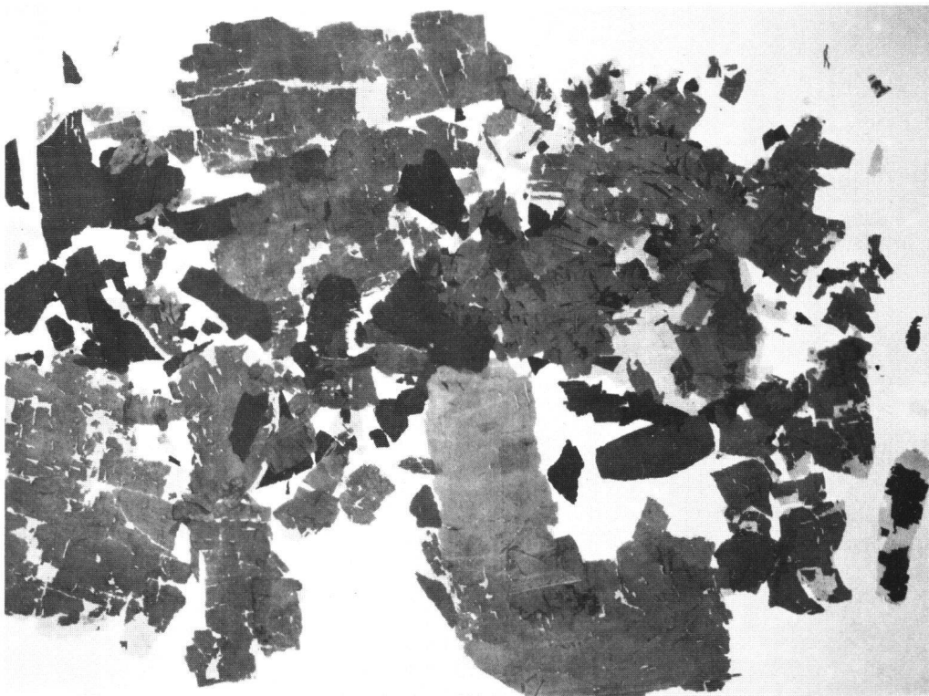
Abb. 1 Fahne des Zürcher Regiments von Steiner in französischen Diensten (1770–1792). Zustand im August 1971. [KZ 5683]

Es stellte sich das Problem, diesen Klebstoff zu entfernen, ohne daß die an sich schon versprödete Seidenfaser dabei weiter geschädigt und merkliche Verluste an Originalgewebe eintreten würden. Die am Landesmuseum geübte Methode des enzymatischen Abbaus solcher Klebstoffe auf