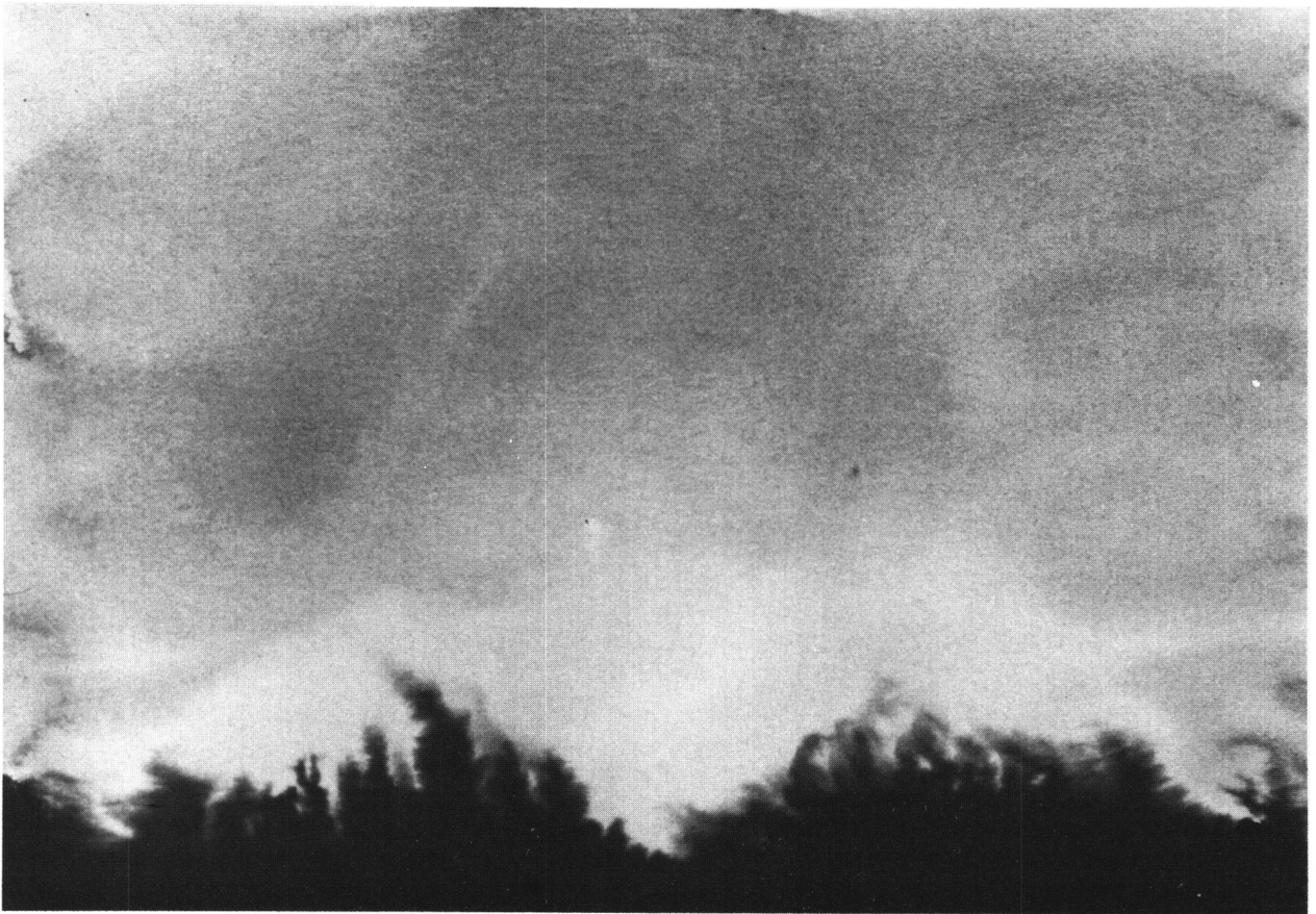
Abb. 1 Markus Raetz: «Dinte», 1976. Tinte auf Papier 16,5×24 cm. Graphische Sammlung des Kunsthhauses Zürich (Z. Inv. Nr. 1977/19).

Hier klingt schon das Kriterium der Originalität an, ein Begriff, der sich immer noch grosser Beliebtheit erfreut. Dagegen sind die verwandten Begriffe Authentizität und Echtheit, die die mehr von Adorno geprägte Diskussion der sechziger Jahre beherrschten, in neuerer Zeit fast gänzlich aus dem kunstkritischen Vokabular verschwunden. Unter einem originalen Kunstwerk verstehen die meisten Kritiker stillschweigend ein Ganzes, das aus noch nie dagewesenen Elementen gebildet wird oder aus bekannten Elementen besteht, die auf diese bestimmte Weise noch nie zusammengefügt wurden.