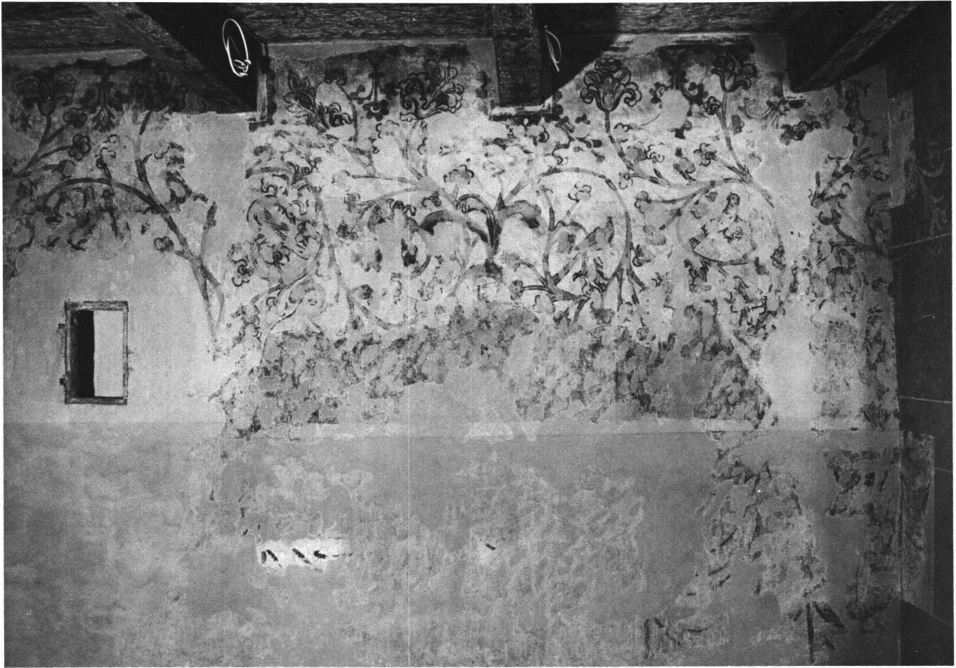
Abb. 4 Südwand: mit den Figuren eins bis vier. Gut erkennbar ist in der Mitte der Mann mit dem dunkel erscheinenden Federhut (drei) und links, kurz vor der Fehlstelle, eine weibliche Figur (vier).

stimmbare fünfteilige Blättchen, Weinblätter mit Rispen sowie üppige, lilienartige Blüten. In und vor den Zweigen sitzen zahlreiche Vögel, bestimmbar sind Eulen, Wiedehopf, Raben und kleine Singvögel 7 (Abb. 7). Vor dieser verdure animée 8 erkennen wir auf der Nordwand deutlich fünf Figuren, zwei weitere in Spuren (Abb. 2, 3). Auf der Südwand sind partiell noch sechs Figuren von ursprünglich wohl acht erhalten (Abb. 4, 5). Sie stehen hinter einer Brüstung, über die in steilen Schüsselfalten ein grüner Vorhang fällt 9 (Abb. 3).