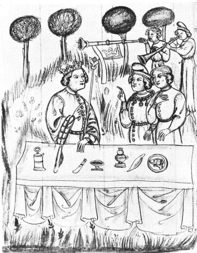
Abb. 8 Gastmahl des Ahasver. Handschrift, Basel Universitätsbibliothek, A II 4, Bl. 135v., um 1400. Man vergleiche die Art der Vorhangdrapierung mit Abb. 3.

Die Darstellungen auf beiden Wänden gehören thematisch zusammen. Sie zeigen Liebespiel und Zeitvertreib einer vornehmen Gesellschaft in einem «locus amoenus», einem gepflegten, von zahlreichen Vögeln belebten und mit Gesang erfüllten Garten. Seit dem 18. Jahrhundert werden solche Darstellungen «Liebesgarten» genannt. Als GUSTAV GLÜCK das gleichnamige Rubensbild untersuchte, waren die frühesten bekannten ikonographischen Zeugnisse die beiden Kupferstiche vom Meister des Liebesgartens 12 . Seitdem wurden etliche mittelalterliche Wandmalereien mit ähnlicher Thematik, besonders am Oberrhein, freigelegt 13 . Daraus wurde geschlos-