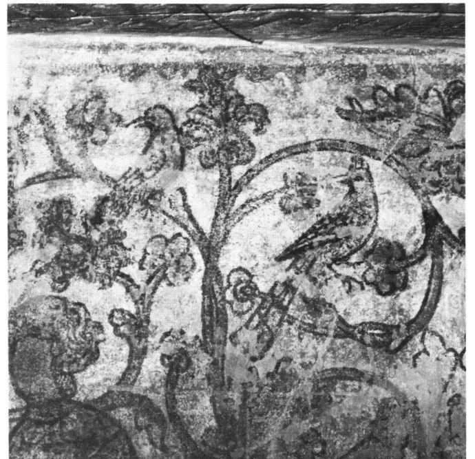
Abb. 7 Nordwand: Ausschnitt aus dem Rankenwerk über der ersten Figur mit Singvogel und Wiedehopf.