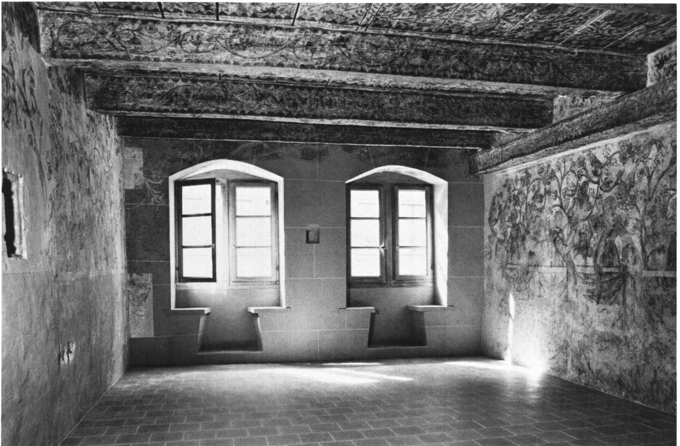
Abb. 1 Basel, Stadthausgasse 18: das bemalte Zimmer im 2. Obergeschoss nach Westen. An der Westwand rekonstruiertes Quaderwerk und die beiden nach dem Erdbeben von 1376 vergrösserten Fenster. Die Wandgemälde befinden sich auf der Südwand (links) und der Nordwand (rechts). Bemalte Balkendecke um 1320.

der Mitte zwischen den Balken sowie diagonal von den Balkenköpfen ausgehen (Abb. 6). Nach vergleichbaren Funden können die Deckenmalereien und mit ihnen die anschliessend ornamentale Schicht der Wanddekoration um 1320 datiert werden 3 . Sie wurden in die spätere, zweite Bemalung des Raumes unangetastet miteinbezogen. Bisher kennen wir in Basel keine andere Ausmalung, wo man ebenso rücksichtsvoll mit dem Bestehenden verfahren wäre. Dies lässt vermuten, dass die älteren Malereien bereits damals als erhaltenswert geschätzt wurden 4 .