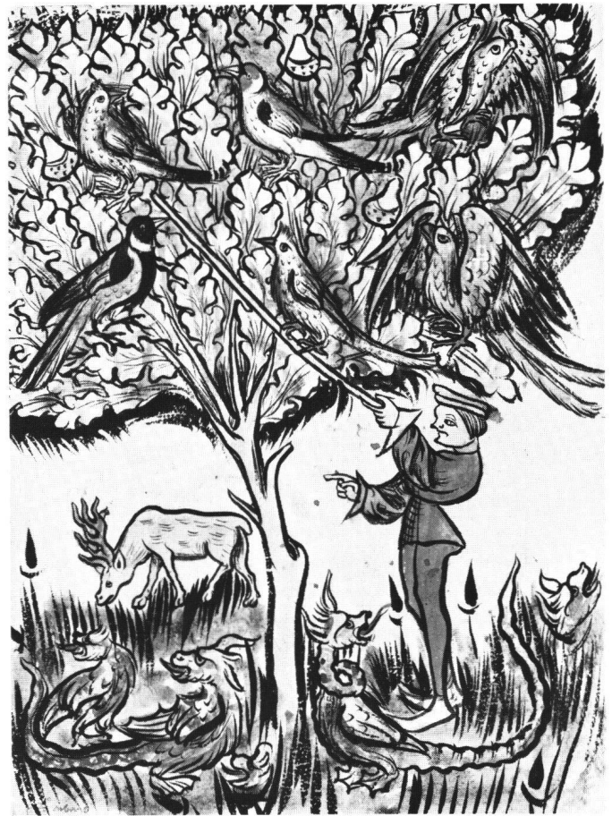
Abb. 9 Traum Nebukadnezars vom grossen Baum mit den Vögeln. Handschrift, Basel Universitätsbibliothek, A II 5, Bl. 84v., um 1400. Vergleichbar mit dem Wandgemälde sind die starke Konturierung sowie die Plazierung der Vögel im Geäst und ihre artengetreue Wiedergabe.

sen, dass Liebesgartendarstellungen sogar das beliebteste Thema für die Ausgestaltung profaner Räume waren 14 . In unserem Zusammenhang möchte ich festhalten, dass sich jeweils die gesellschaftliche Oberschicht in einem solchen Garten zu Spiel, Flirt und dem Genuss ausgewählter Speisen und Getränke einfand. Sie liess sich hier in idealisierter Weise darstellen 15 .