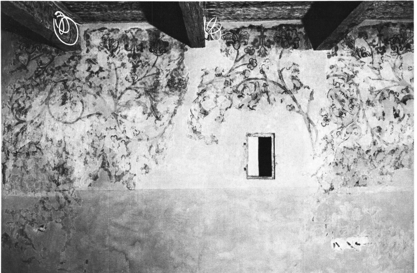
Abb. 5 Südwand: die Figuren vier, fünf und sechs. Etwa in der Mitte zwischen Nische und linkem Wandende befindet sich der Mann mit dem roten Beret (fünf), ganz links die letzte Frauengestalt (sechs).