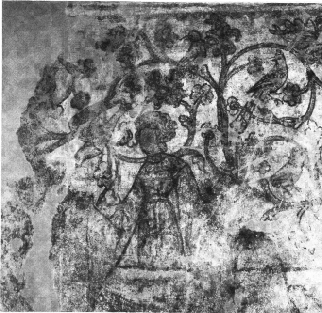
Abb. 2 Nordwand: die erste Figur, bekleidet mit Kruseler und einem Gewand mit langen Zipfelärmeln.