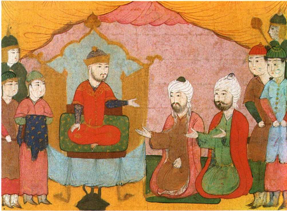
Fig. 6 Kalila et Dimna (folio 7). Sultân Bahrâm Shâh et sa cour. (Miniature analysée).

diens, si l'on en juge par la manière d'utiliser le pigment et la tonalité d'ensemble des peintures.