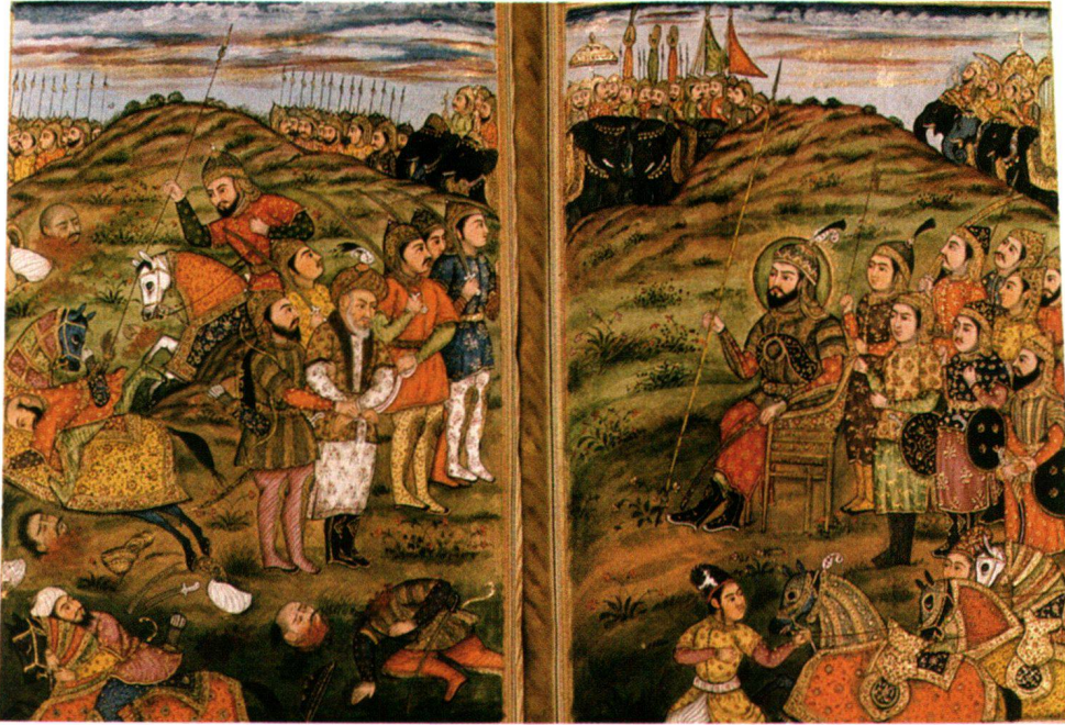
Fig. 4 et 5 Malfūzāt-i Tīmūr (folios 487 et 488). Inde, 1820. (page droite: H. 0,205 m; L. 0,148 m. Page gauche: H. 0,208 m; L. 0,155 m). Prisonniers présentés à Tīmūr.