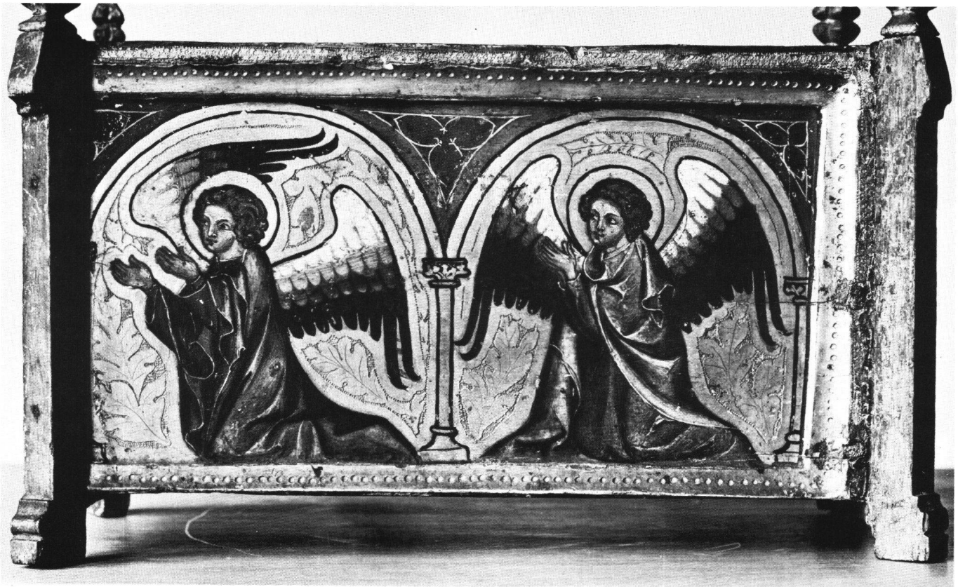
Abb. 3 Christkindwiege. Zweite Langseite mit zwei knienden Engeln, Malerei um 1340.

werden, ob es sich wirklich um ein Original des 14. Jahrhunderts handelt.