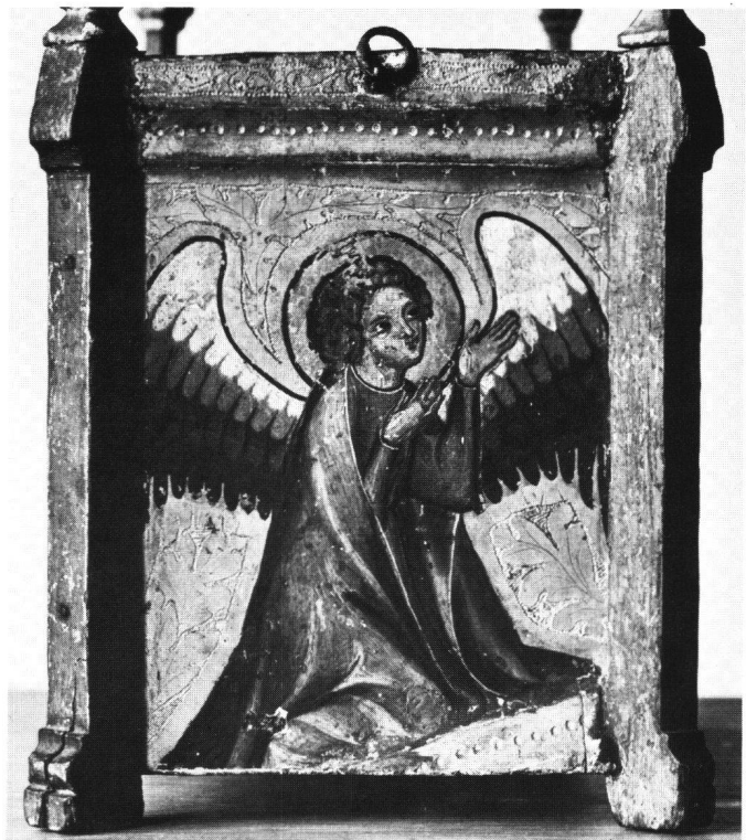
Abb. 4 Christkindwiege. Erste Stirnseite mit kniendem Engel, Malerei um 1340.

Auch am Gestell gibt es einige Merkwürdigkeiten. Auf die ungotische Form der Bekrönungen sowie auf die dilettantische Herstellung der «Finger» an den Docks des Gestells wurde schon