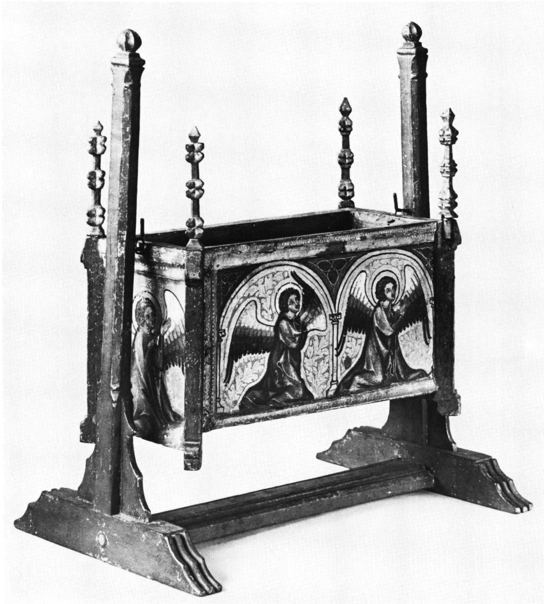
Abb. 1 Christkindwiege im Bayerischen Nationalmuseum in München. (Gesamtmasse H 37 cm, B 32 cm, T 21,5 cm.)

Im Bayerischen Nationalmuseum befindet sich eine Christkindwiege von einiger Berühmtheit, die seit 1878 bis in unsere Tage immer wieder in der Literatur erscheint (Abb. 1) 1 . Es handelt sich dabei um eines jener kleinen Andachtsmöbel, die dem mancherorts