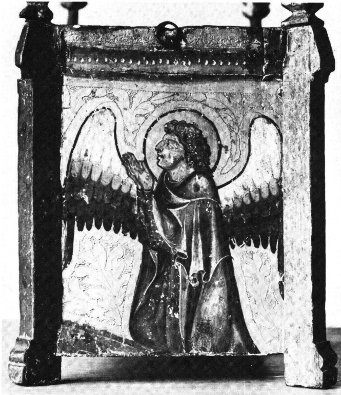
Abb. 5 Christkindwiege. Zweite Stirnseite mit knieendem Engel, Malerei um 1340.

verwiesen. Die dreimal einschwingenden Brettchenzwickel tragen alle Merkmale neugotischer Laubsägearbeiten. Technisch korrekt sind die Ständer in die Fussstollen eingezapft und mit Holznägeln versehen. Absolut unzünftig ist dagegen wiederum die Verbindung des Stegs, der mit seiner ganzen Stärke eingezapft ist, wobei das Loch der Profilierung nur oberflächlich angepasst ist. Der Wiegenkasten hängt an zu Haken umgebogenen Drahtstiften; mit maschinell hergestellten Drahtstiften sind auch die Strebepfeiler an den Bettkasten genagelt.