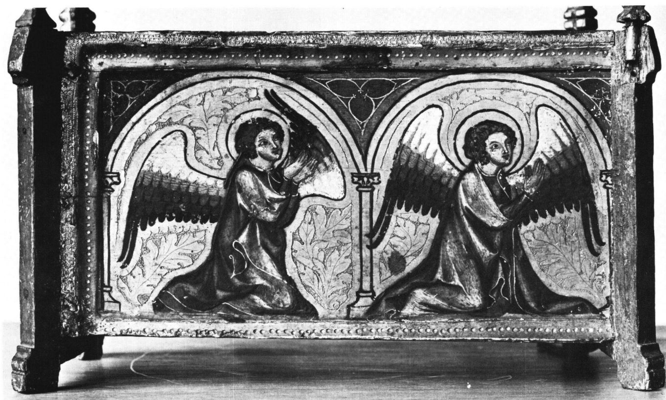
Abb. 2 Christkindwiege. Erste Langseite mit zwei knienden Engeln, Malerei um 1340.

Medingen bei Dillingen mit Heinrich von Nördlingen, dem sie 1344 unter anderem schreibt, «daz mir wart gesendet von Wiene ain minneklichez bilde, daz was ain Jhesus in ainer wiegen» 3 .