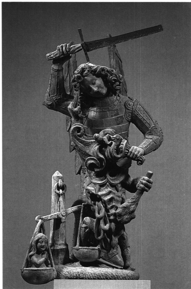
Abb. 3 Erzengel Michael, Zustand 1984.

Eine erste Untersuchung bestätigte die Voraussage ZEMP's, wonach die Polychromierung des Hauptportals nur partielle Fassungen zeige, deutlich erkennbar etwa an Gewandsäumen, Schmuckteilen oder Haartrachten. INDERMÜHLE seinerseits hatte behauptet, die Figuren seien ursprünglich ganz, wenn auch «diskret» bemalt gewesen. «Im Gegensatz zu den meisten noch erhaltenen mittelalterlichen Kirchenportalen, die ohne Ausnahme vollständig bemalt und meistens mit Gold gefasst waren, zeigen bei unserem Portal nur die Figuren farbigen Schmuck. Die Farbe ist sorgfältig überlegt verwendet und dient fast mehr zum Unterstreichen der besonders bildhauerischen Schmuckteile. Die ganze Art der Bemalung erinnert an diejenige der beginnenden Renaissance.