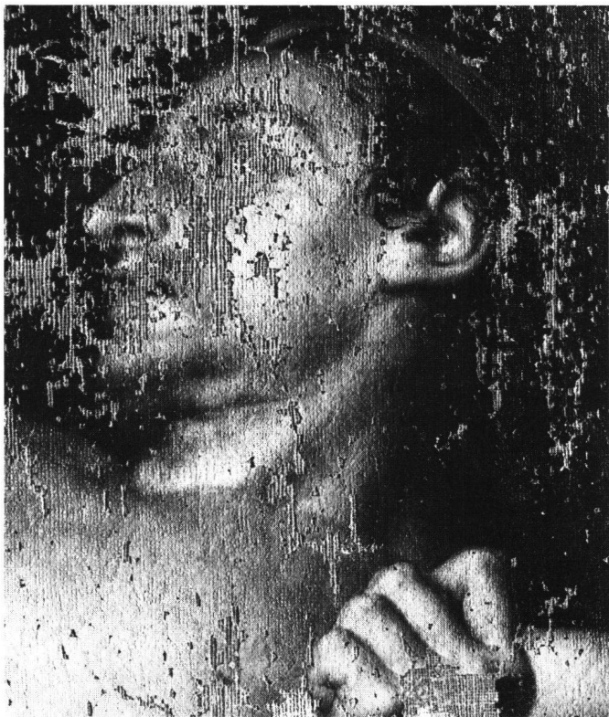
Abb. 2 Jean-Pierre Saint-Ours (1752–1809). Ein Gefangener (um 1786), Detail des Kopfes. Öl auf Leinwand 172×123,5 cm. Musée d'art et d'histoire, Genève, ancien fonds du Musée Rath, Inv. 1825–35. – Solche massive Schäden als Folge ungünstiger Klimabedingungen sind an Leinwandbildern leider nicht selten.

Mit Hilfe des NFP 16 ist die AGPB zurzeit daran, in Bern ein regionales Zentrum für Papierrestaurierung einzurichten, an welchem Spezialisten an der Entwicklung neuer Methoden arbeiten, die Alterung des Materials studieren und für die Ausbildung des Nachwuchses sorgen werden. Ohne auf Einzelheiten einzutreten,