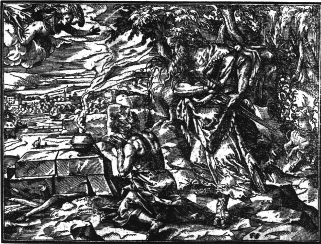
Abb. 17 Tobias Stimmer: Abraham und Isaak. Aus «Josephus Flavius, Historien und Bücher...», 1574. Holzschnitt Fol. 13 recto (Formschneider Hans Christoffel Stimmer).