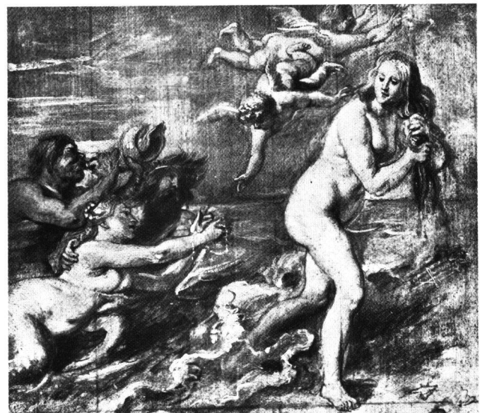
Abb. 5 Peter Paul Rubens: «Geburt der Venus», um 1636/38. Ölskizze. Brüssel, Musées Royaux des Beaux-Arts.