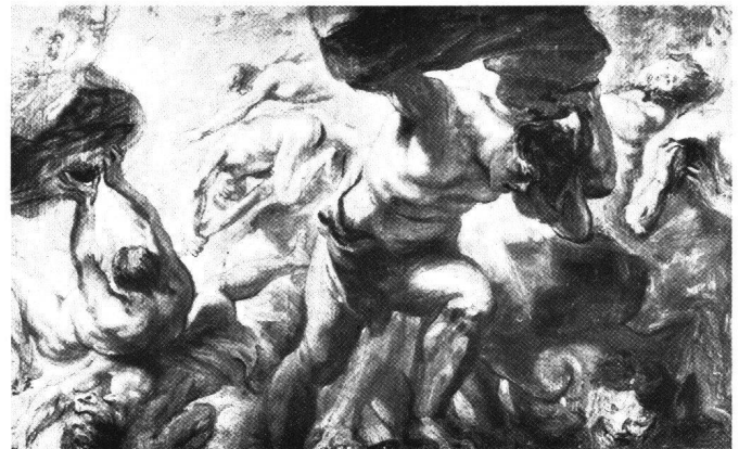
Abb. 16 Peter Paul Rubens: Titanensturz, um 1636/38. Ölskizze. Brüssel, Musées Royaux des Beaux-Arts.