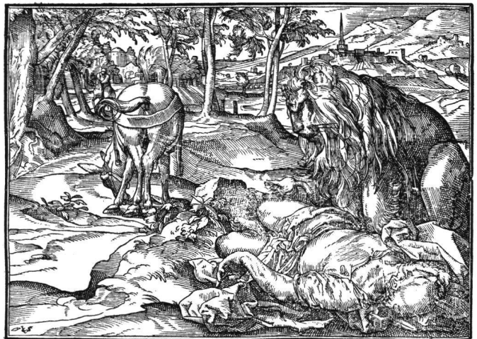
Abb. 13 Tobias Stimmer: Die Strafe des ungehorsamen Gottesmannes. Aus «Josephus Flavius, Historien und Bücher...», 1574. Holzschnitt Fol. 125 verso (Formschneider Christoffel van Sichem).

Eine solche Beteiligung des Betrachters durch direkte Einholungen formaler und emotiver Art wird bekanntlich in der Bildregie des Barocks zu ihrer vollen Konsequenz kommen. Indem der Bildraum – und was darin geschieht – in den Betrachterraum geöffnet wird, kühnen Tiefenachsen folgend, die «heilige» vordere