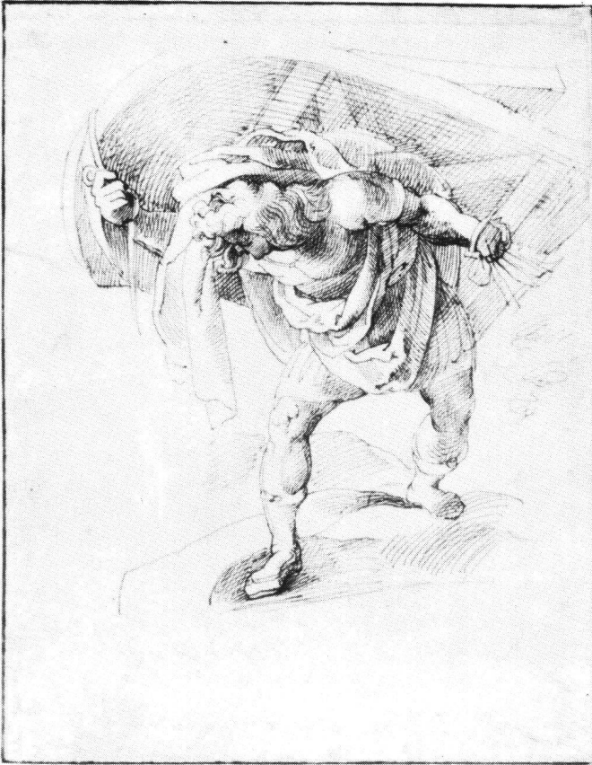
Abb. 14 Peter Paul Rubens: Samson trägt die Türen des Stadttors von Gaza weg, nach Tobias Stimmer, um 1595/98. Federzeichnung. Antwerpen, Sammlung André Leysen.

Bildschranke tangierend und durchbrechend, stellt sich ein neuartiger Illusionseffekt ein. Das Engagement der «dramatis personae», ihre Regungen und Affekte übertragen sich reflektorisch auf den Betrachter, der sich sogleich identifiziert. Indem Rubens just solche Impulse von Stimmer aufnimmt und seinem Schaffen einverleibt, kennzeichnet er rückwärts seine Quelle als protobarock. Tatsächlich ist die Lehre von der emotiven Identifikation des Betrachters schon von Stimmer in mehreren Varianten erprobt. Allerdings, aufs Ganze gesehen, handelt es sich erst um Ansätze innerhalb herkömmlicher, noch auf Dürer, Holbein und andern Renaissance-Meistern beruhenden Strukturen. 40