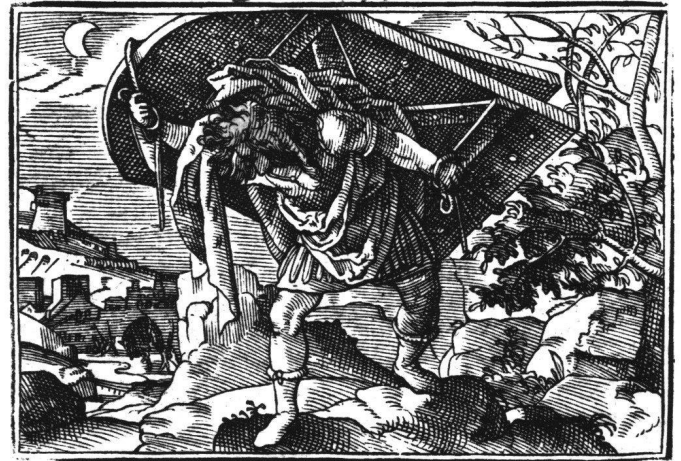
Abb. 15 Tobias Stimmer: Samson trägt die Türen des Stadttors von Gaza weg. Aus «Neue Künstliche Figuren Biblischer Historien», 1576. Holzschnitt 69.

An dieser Stelle kommt man in Versuchung, zur Beglaubigung des Barockgehalts in seinen Kühnheiten einen eher übermütigen Sprung zu tun. 1584, das Todesjahr Stimmers, ist zugleich ein markantes Carracci-Jahr. «Bologna 1584» hiess eine bolognesische