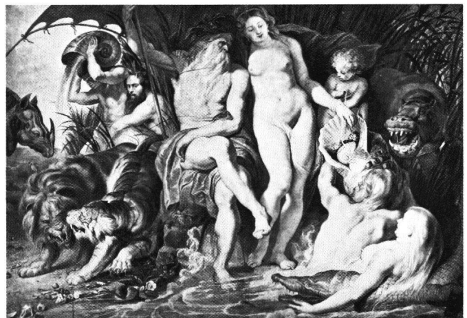
Abb. 4 Peter Paul Rubens: «Neptun und Amphitrite», um 1618, Berlin-Dahlem, Staatliche Museen Preussischer Kulturbesitz.

Das Skizzenblatt mit vier weiblichen Akten (Louvre Abb. 1) 11 entspricht dem traditionellen Musterbuchverfahren: viermal ein Akt; viermal in einer andern Haltung und Bewegung, stehend, liegend, wegeilend; viermal aus einer andern Bildquelle (davon eine aus Jost Amman 12 ), je unverbunden; jede für sich abrufbar für späteren Gebrauch – zusammen ein kleines Repertoire exemplarischer weiblicher Aktmotive. Alle vier stammen aus Eva-Szenen (Abb. 2 und 3), doch sind die Eva-Attribute ausgeschieden. Damit sind die Figuren mit ihren Bewegungstopoi verfügbar gemacht.