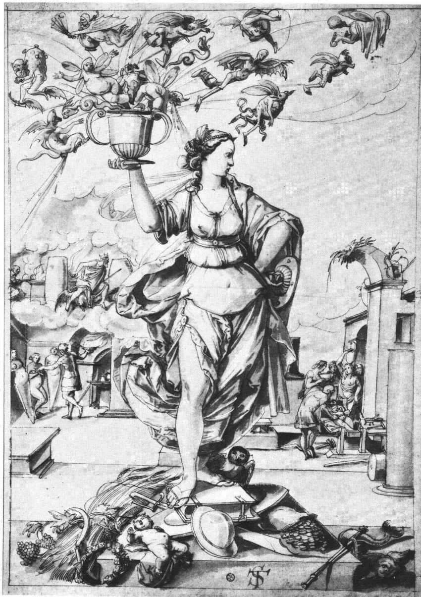
Abb. 1 Tobias Stimmer: Pandora. Federzeichnung, violett laviert. Basel, Kupferstichkabinett.

von HANS SACHS aufschlussreich ist. 12 Die Eule, die trotz Sonnenlicht, Brille und Kerze nicht sehen kann, wird zum Sinnbild des Sünders, der Menschheit, die (so SACHS): «Verstockt, verstarret und erblindt / In wucher, geytz und Tyranny / In lügen, list und triegerey / Jm Ehbruch, hurerey und frass / Jn kriegem, zoren neyd und hass / Jn ungehorsam und Gotslestern / ey heut viel gröber noch dann gestern». Und Sachs ruft seine Leser an: «Derhalb du sündig blinder hauff / Wach auss der nacht der sünden auff / Vnd ermunter deyn blöd gesicht / weyl du noch hast das helle licht / Christum die Sonn der gerechtigkeit».