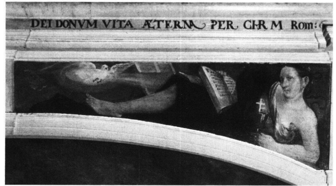
Abb. 3 Tobias Stimmer: Erlösung. Holztafel. Strassburg Kathedrale, Astronomische Uhr.

auch MELANCHTHON Pandora mit dem sinnlich Triebhaften in Verbindung bringen. Geben wir Satan das Wort, der im Pandorastück Culmans die Büchse Pandoras folgendermassen deutet: «Dann wo der wollust wird begert / Do wirt auch mein reych gemert / Wo Venus knecht zusammen kumen / Do wird die buchs angenommen / Die buechs aber ist wollust und freud / Daraus dann entspringet gross leyd . . .». 17 Bei Melanchthon wird Pandora selbst zur «Voluptas», und Prometheus, der Vorsichtige, der Pandora nicht angenommen hat, wird zum Inbegriff des weisen Mannes. 18 Das Thema, das hier anklingt und auf das Stimmer mit dem Delphin diskret hinweist, ist die Wollust als Ursache aller Heimsuchungen des Menschengeschlechts. Er wird es dann in Baden-Baden drastisch schildern.